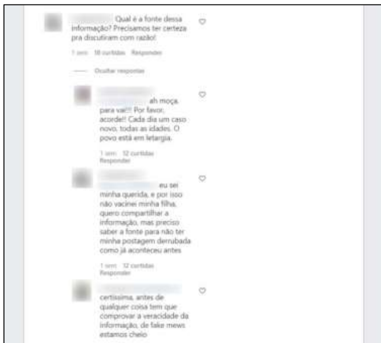
Figura 6: Sequência de prints dos comentários na desinformação em que associava a morte do jovem de 22 anos a vacina da COVID-19