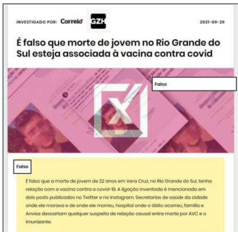
Figura 3: Verificação produzida pelo Comprova sobre a desinformação que associava a morte do jovem de 22 anos do Rio Grande do Sul com a vacina da COVID-19