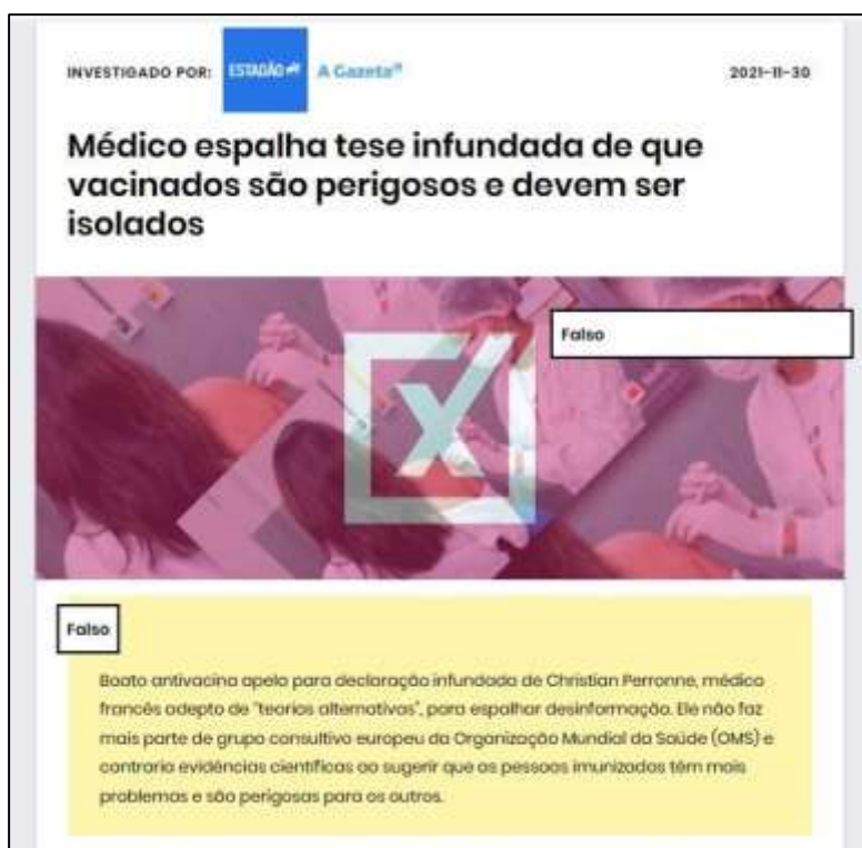
Figura 7: Verificação produzida pelo Comprova sobre a desinformação disseminada pelo médico francês em que apontava que as pessoas vacinadas são perigosas e deveriam ser isoladas