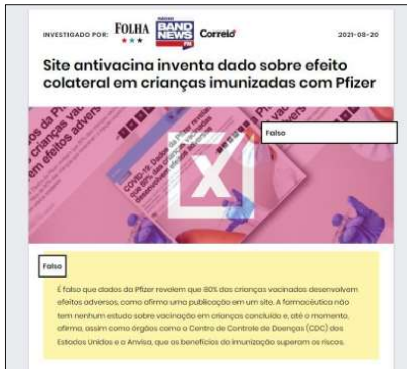
Figura 8: Verificação produzida pelo Comprova em que site antivacina relaciona efeitos adversos em crianças

O material foi checado pelo Comprova a partir da lista de monitoramento de conteúdos que circulam na Internet, sugeridos por alguns leitores do projeto. A verificação foi realizada pelos veículos Folha de São Paulo, Band News, Correio, Correio de Carajás, Sistema Jornal Comércio de Comunicação, O Povo, Estadão e Piauí.