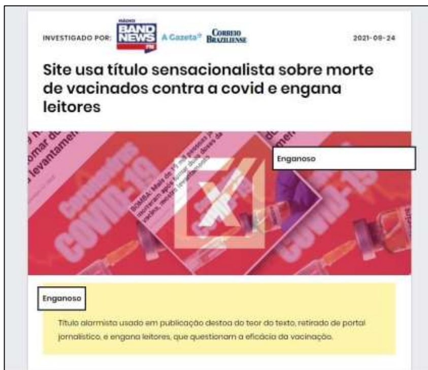
Figura 9: Verificação produzida pelo Comprova em que site de cunho jornalístico distorce informações sobre mortos após a vacinação