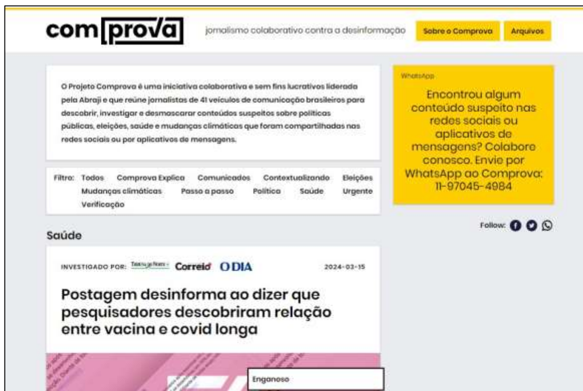
Figura 1: Página inicial do Projeto Comprova

cidade de Sydney. No mês de junho de 2022, após sete anos de atuação, o First Draft comunicou o encerramento de suas atividades e o arquivamento do site pela Internet Archive. No site da instituição não consta o motivo do fechamento da plataforma e do fim do seu trabalho.