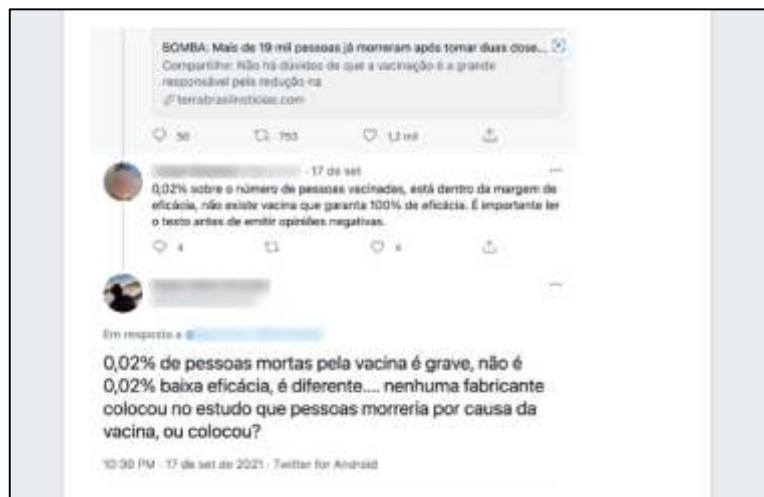
Figura 12: sequência de prints dos comentários sobre a matéria do site de cunho jornalístico que distorceu a informação dos óbitos de pessoas após a vacinação