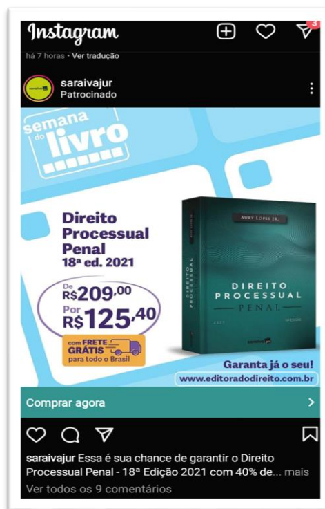
Imagem 4 – Publicidade algorítmica no ambiente virtual da plataforma Instagram

Conforme se observa na imagem 4, a publicidade algorítmica também é amplamente empregada no ambiente virtual da plataforma Instagram, que ocupa a quarta posição no ranking das redes sociais mais utilizadas no mundo, com 1,2 bilhão de usuários ativos: 109