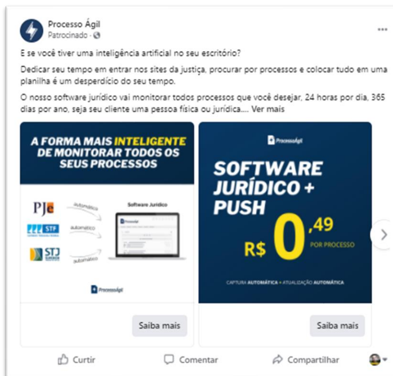
Imagem 1 – Publicidade algorítmica no ambiente virtual da plataforma Facebook

(a maior rede social do mundo, com 2,7 bilhões de usuários ativos) 105 :