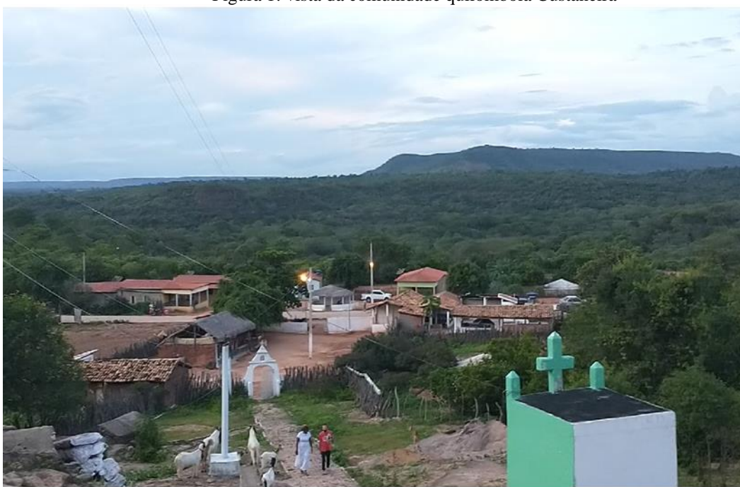
Figura 1: vista da comunidade quilombola Custaneira

A comunidade Custaneira, denominação que até os tempos atuais não se sabe de fato sua origem, está inserida em um contexto típico de muitas comunidades rurais existentes no interior do Piauí, uma região em que predomina o trabalho agrícola, especialmente a agricultura familiar, em que as famílias tiram do campo seu sustento e cuidado com a saúde. Esse espaço define-se pela escassez de recursos, com o desenvolvimento tardio, insuficiência no sistema educacional e nas condições de saúde e lazer, possuindo muitas marcas do passado em que a população negra precisou lutar contra a repressão e a privação de liberdade.