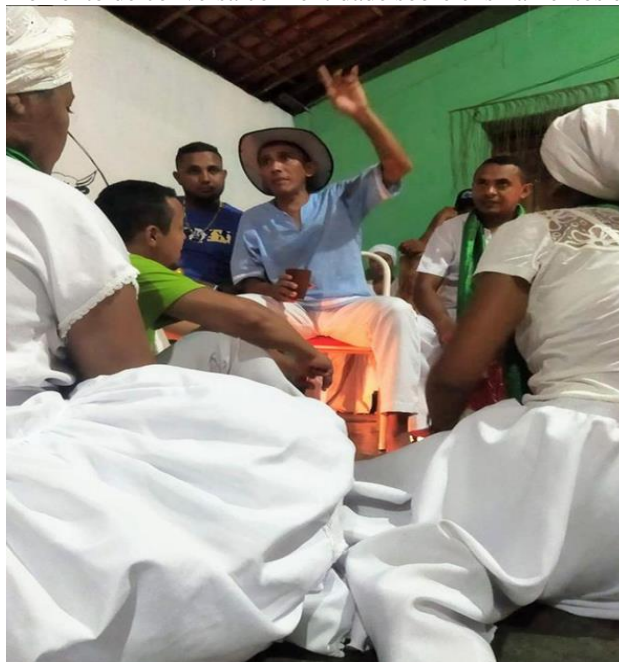
Figura 20: Momento de conversa com entidade sobre ensinamentos da Umbanda