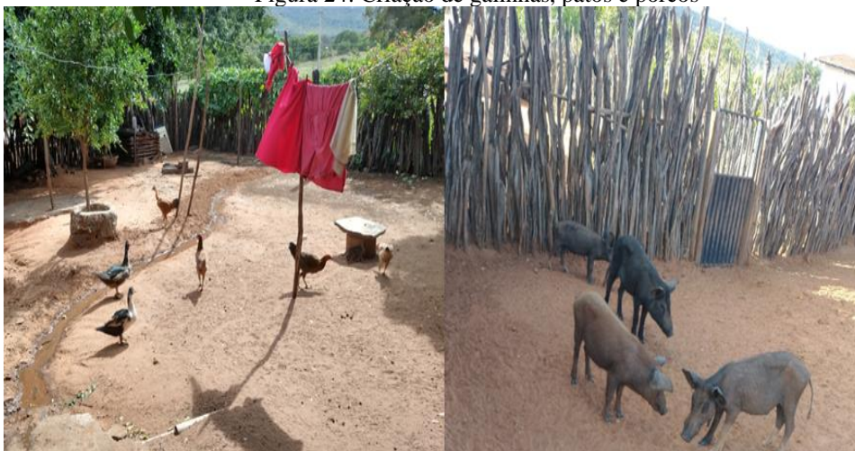
Figura 24: Criação de galinhas, patos e porcos