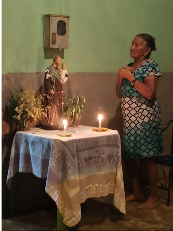
Figura 10: encontro na casa de Dona Ana para a meditação do terço