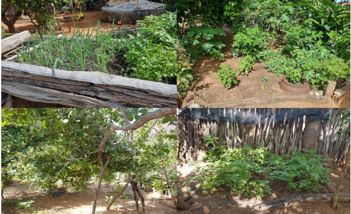
Figura 22: Plantação de verduras, legumes e frutas no quintal de Dona Rita

terra, da adubação, de regar, de manter e de colher. Criando nesse ritual, um vínculo da qual se torna necessário à obtenção deste tipo de plantio, especialmente pelos mais velhos, sendo muito comuns em seus quintais.