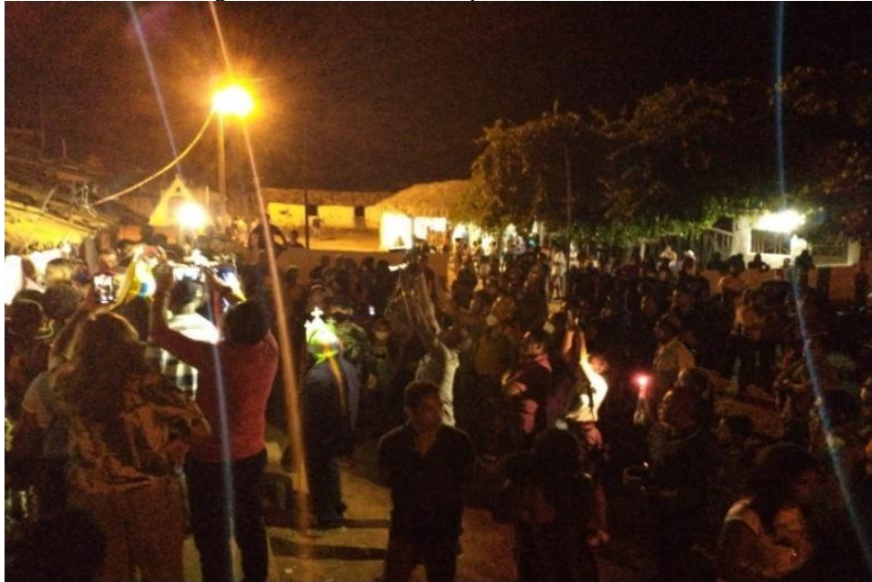
Figura 11: Pessoas reunidas para início do Reisado