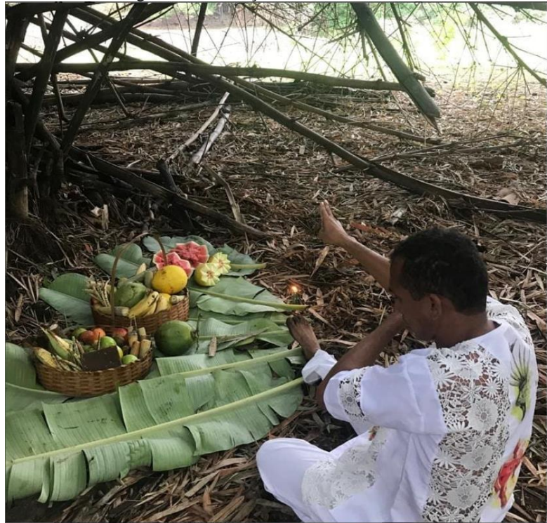
Figura 4: Realização de oferendas na mata