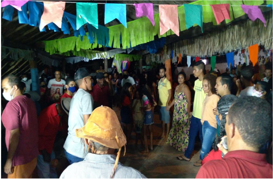
Figura 14: Roda de Samba de Lezera