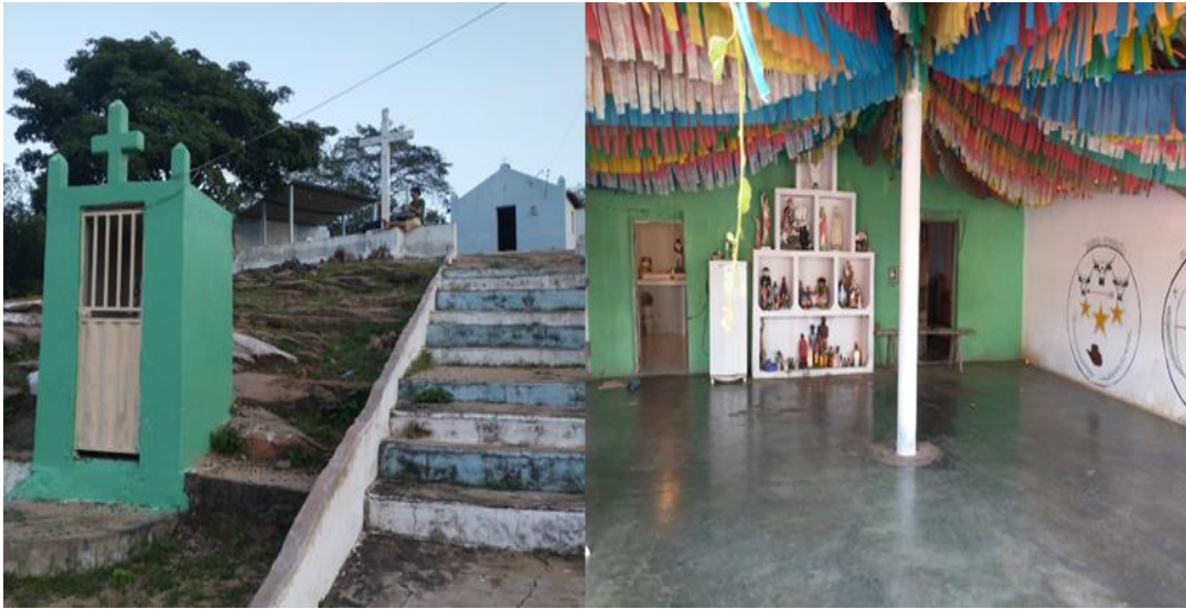
Figura 5: Espaços religiosos da Custaneira: à direita capela do Sagrado Coração de Jesus; à esquerda Terreiro de Umbanda