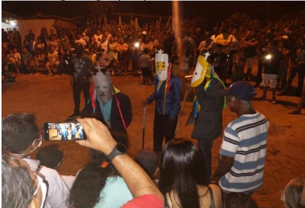
Figura 13: Figuras que compõem a história narrada durante o Reizado