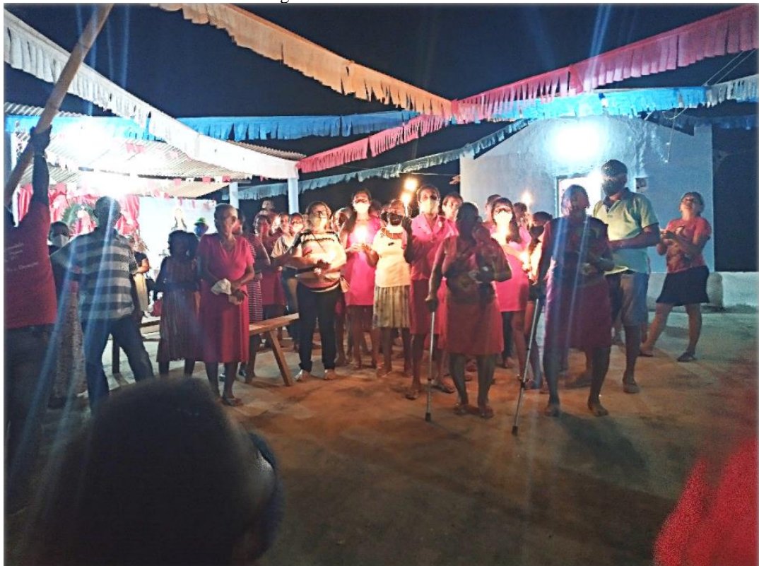
Figura 8: Hasteada da bandeira