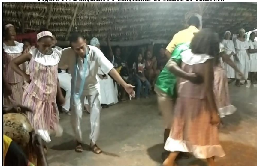
Figura 17: Dançarinos e dançarinas do samba de cumbuca