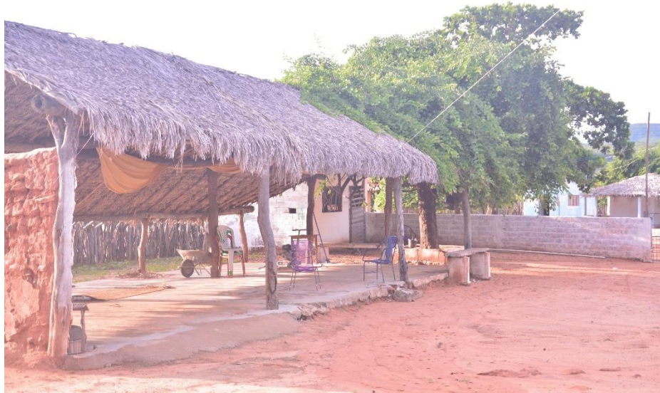
Figura 6: Salão comunitário