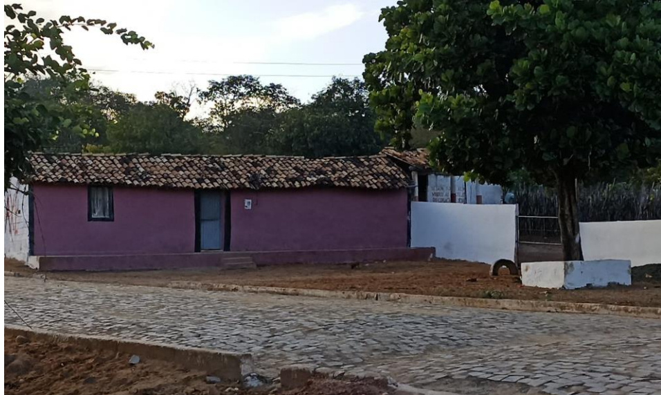
Figura 19: Casa utilizada como quermesse