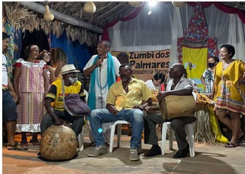
Figura 16: Cantores e tocadores do Samba de Cumbuca

Outro símbolo da cultura dessa comunidade é o Samba de Cumbuca, geralmente realizado nos momentos de descontração, após reuniões ou até mesmo eventos como os já citados. O samba de cumbuca é uma forma de exaltar os ancestrais que costumavam realizar esta roda, contendo a resistência do negro em suas letras, pois assim como a Lezera, a dança retrata a vida do negro com histórias acerca do seu cotidiano, comumente rimadas durante a roda, quando um dos cantores cria uma rima chamando pro diálogo, enquanto os dançarinos batem com o calçado no chão, pisando firma e produzindo sons que acompanham os tocadores, animando a festa.