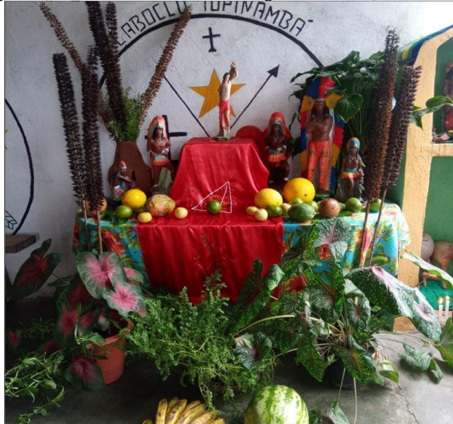
Figura 18: Festa celebrada em homenagem a Oxóssi (São Sebastião)

Quanto às atividades no terreiro, para além das consultas com as entidades, há as giras, que consistem no ritual religioso desses fiéis, oportunidade que tem para cultuarem o sagrado e praticarem seus dogmas. Assim como as festas católicas, em que celebram o dia de cada santo, nesses rituais realizam as solenidades dirigidas às entidades, não havendo uma data fixa para todos os anos, eles se baseiam de acordo com o desejo das entidades, algumas vezes, as festas são de acordo com o calendário cristão católico, por decorrer conforme o sincretismo religioso. Por exemplo, no mês de janeiro durante a novena de São Sebastião, é realizada a festividade direcionada a Oxóssi, guardião da casa, este ritual ocorre em forma de agradecimento pela ajuda e trabalho que elas realizam no terreiro.