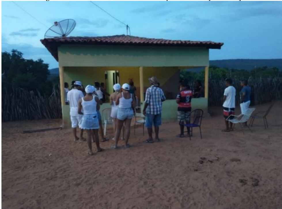
Figura 9: Encontro na casa de Dona Ana para a meditação do terço

Bendito louvado seja meu divino São José vós nos deu chuva na terra, meu Jesus de Nazaré Meu divino São José pela cruz que traz nas mãos Nem de fome e nem de sede não matais seus filhos não Meu divino São José pela cruz que traz nos braços Nem de fome e nem de sede não deixas nós se acabar Meu divino São José pela vos santa fé nos dê chuva na terra meu Jesus de Nazaré quem quiser chuva na terra se apegue com São José ele é um santo milagroso pela vossa santa fé vamos fazer penitência, com Cristo no coração é de vê em horas instante a chuva que deu no chão oferecemos esse bendito a meu divino São José que nos dê chuva na terra meu Jesus de Nazaré.