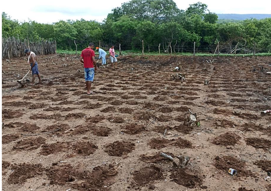
Figura 21: Homens realizando a plantação de milho e feijão

Em seguida, a plantação em que é distribuída no terreno as sementes dos alimentos que desejam cultivar, neste processo, homens e mulheres se reúnem, enquanto um cavava as “covas” com a enxada, o outro despeja as sementes e as cobre com os pés, como se fosse um passo de dança em que um se sincroniza no outro, havendo o cuidado de colocar a quantidade certa e tampar a “cova”, de forma que guarde bem os grãos e estes venham florescer. Não há preocupação com a adubação e fortalecimento do solo, já que para eles isso acontece de forma natural ou com os estercos dos bois, vacas e cavalos que são lançados nas roças, no período do verão, quando esses animais são deixados para comerem o que sobrou do pasto, além de depositar a confiança em suas crenças, entendendo que as forças divinas irão escutar suas preces e permitir que tenham fartura com essa plantação. Nesse processo, há todo um ritual místico para se ter bons resultados, fazem preces, promessas, pedidos e celebrações confiantes em terem respostas.