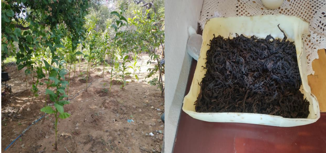
Figura 23: Plantação e colheita de fumo