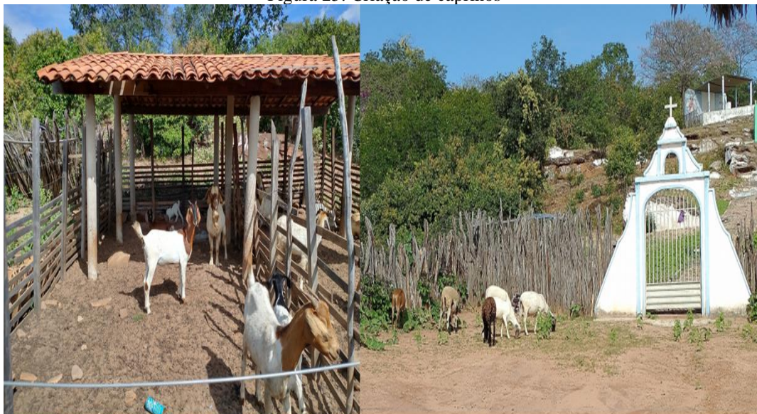
Figura 25: Criação de caprinos

Já na criação de bodes, carneiros e cabras esses não permanecem o tempo todo soltos nos terreiros, ficando uma parte do tempo presos em pequenos currais de madeira – parte do dia e a noite – e outra fração livres para andarem pelos espaços e se alimentarem da vegetação próximas as casas, para esses, também são destinadas a ração de milho; é comum que os moradores pegam os filhotes e criam próximos a suas casas, amamentando-os com leite retirados de outros animais, caso sua mãe não tenha ou o filhote seja adquirido em compras. Esses animais servem para consumo e venda, quando há a necessidade de vender.