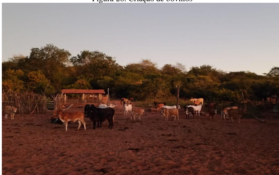
Figura 26: Criação de bovinos

consumo, pois destes são aproveitados o leite e a carne. Geralmente são abatidos quando há festas na comunidade, nos festejos, nas festas de Lourenço Légua 35 realizadas no salão de Umbanda, entre outras, devido haver a recepção de pessoas de vários lugares, nessas ocasiões, os homens se reúnem para abater o animal, tratar e cortar, enquanto as mulheres fazem o preparo da comida. Esses animais se alimentam de pastos dispostos nas roças em época de verão, ou da vegetação que faz parte dos espaços da Custaneira.