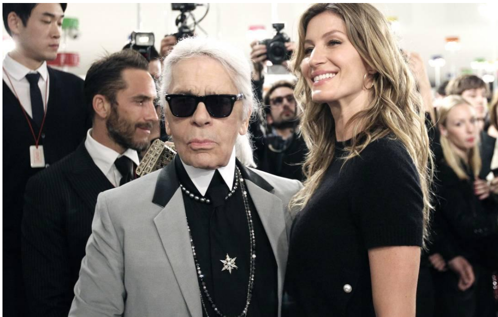
Figura 2: A modelo brasileira Gisele Bündchen, considerada a top nº 1 e mais bem paga do mundo, ao lado de Karl Lagerfeld, estilista da marca Chanel, durante o desfile da marca, cercados de jornalistas e fotógrafos.

Fonte: site Google. Acesso em julho de 2015.