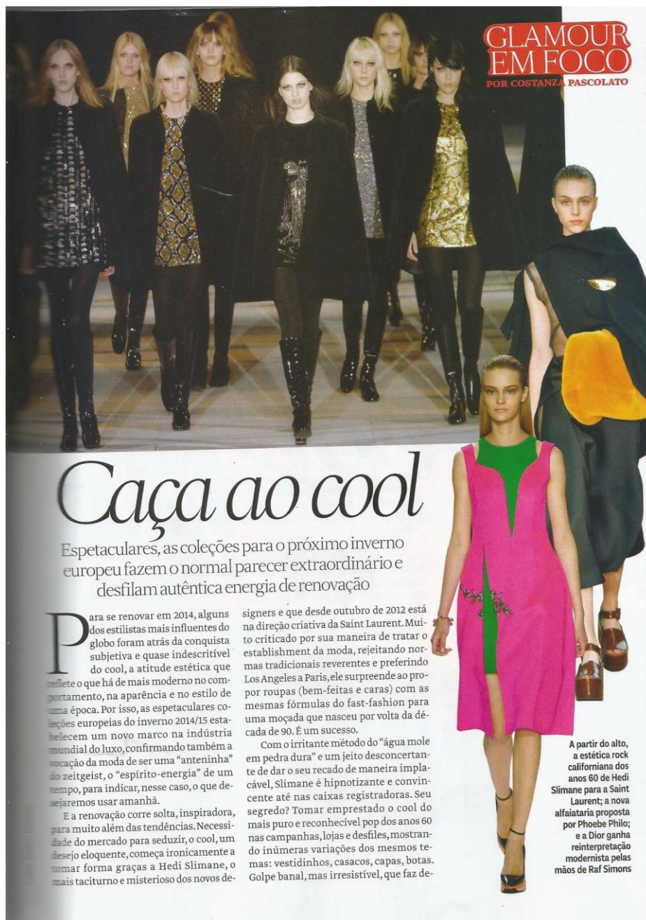
Figura 5: Glamour em foco Fonte: VOGUE, abril de 2014

Em sua coluna do mês de abril, a consultora de moda traz um compilado dos principais desfiles internacionais, onde as principais marcas trazem o mesmo universo de referência que é o estilo cool , que, segundo Constanza, é “a atitude estética que reflete o que há de mais moderno no comportamento, na aparência e no estilo de uma época” (VOGUE, 2014, p. 67). Em seu discurso, a consultora faz uma avaliação de como as principais marcas trazem pra si e para os consumidores da moda a atitude e estilo moderno trazidos em suas passarelas.