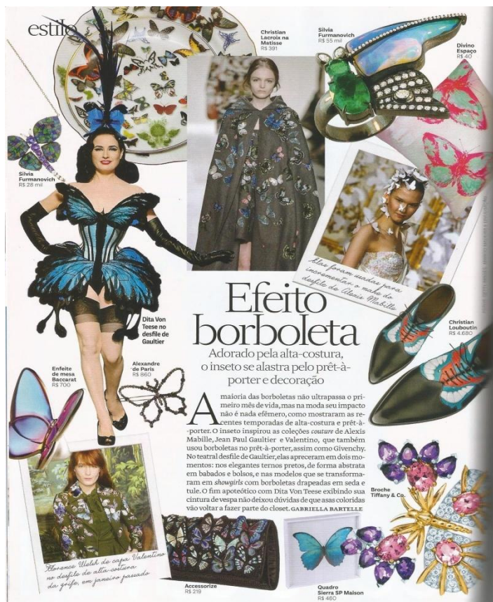
Figura 11: Estilo

Com o uso da metáfora “ Efeito borboleta ” trazido do cinema para representar a tendência de estampas do inseto, Vogue apresenta um discurso a fim de naturalizá-lo enquanto tendência. A revista não se utiliza apenas da ideologia, mas também daquilo que Pinto (2002) classifica como modo de mostrar. Com uma página repleta de borboletas, Vogue mostra as diversas maneiras de usar a tendência, inclusive como forma de decoração de ambientes. Para isso, a revista informa o seu leitor de onde as tendências vieram e avalia como “adorado pela alta-costura o inseto se alastra pelo prêt-à-porter e decoração” (VOGUE, 2014, p. 94).