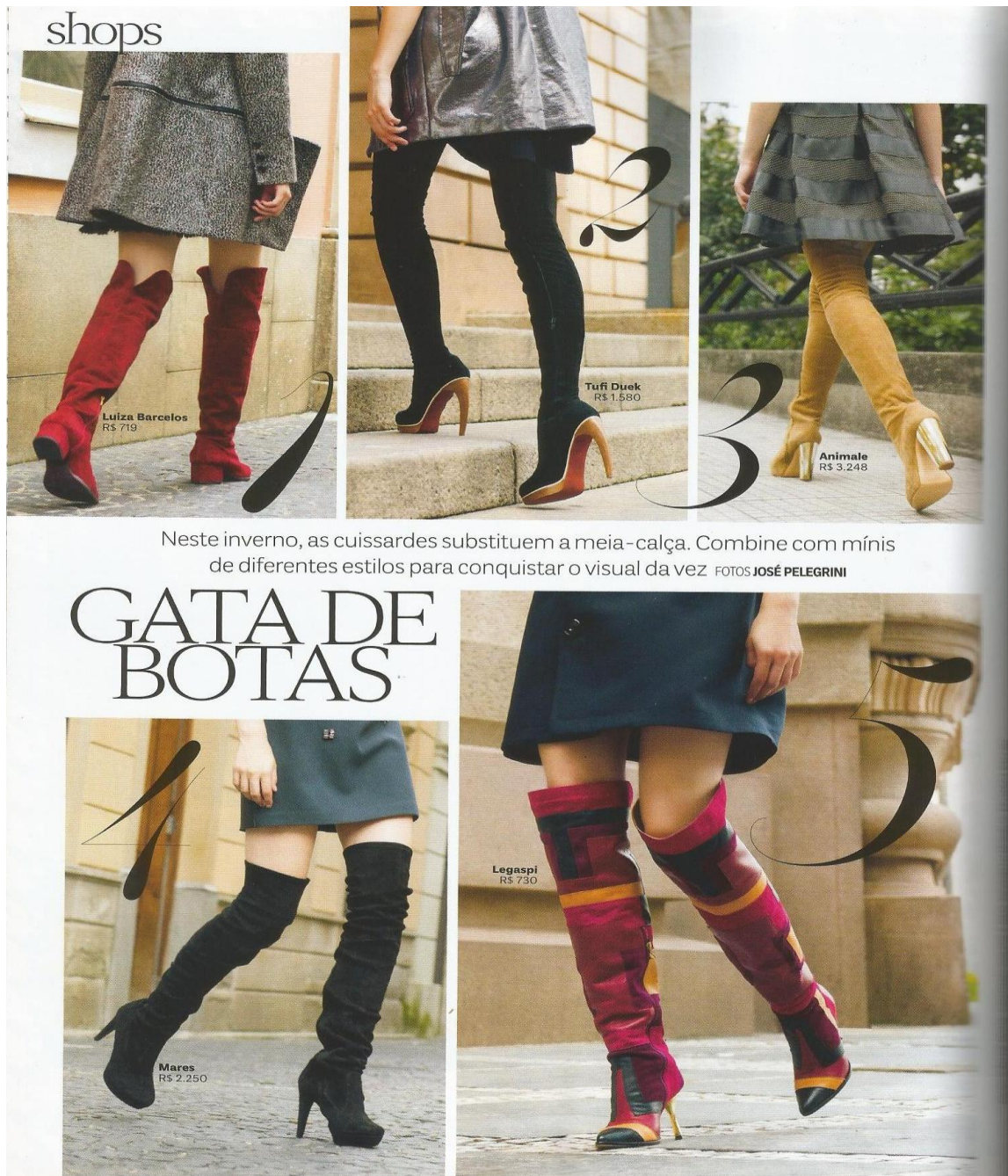
Figura 12: Shops

Nesta figura, podemos ver a metáfora utilizada como título para chamar a atenção de seu leitor. Como discutido no tópico do capítulo dois, as metáforas são utilizadas para que possamos compreender uma coisa no lugar de outra, ou seja, são associações que fazemos para entender determinadas ações. Um conto clássico, o gato de botas carrega consigo um acessório que o difere dos demais, um par de botas herdadas de seu pai. Em outras versões