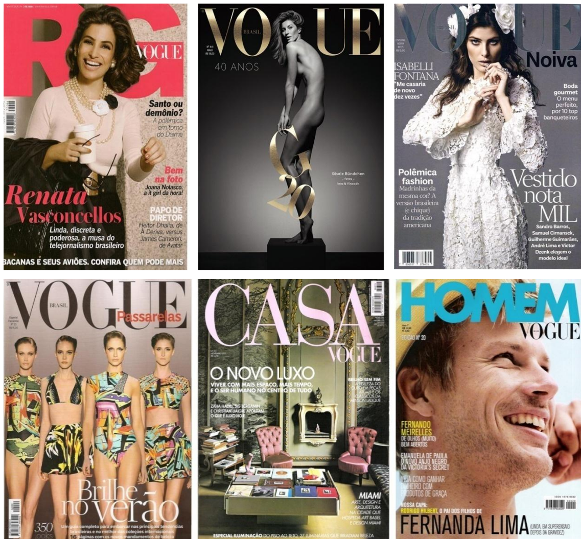
Figura 3 – Capas Vogue