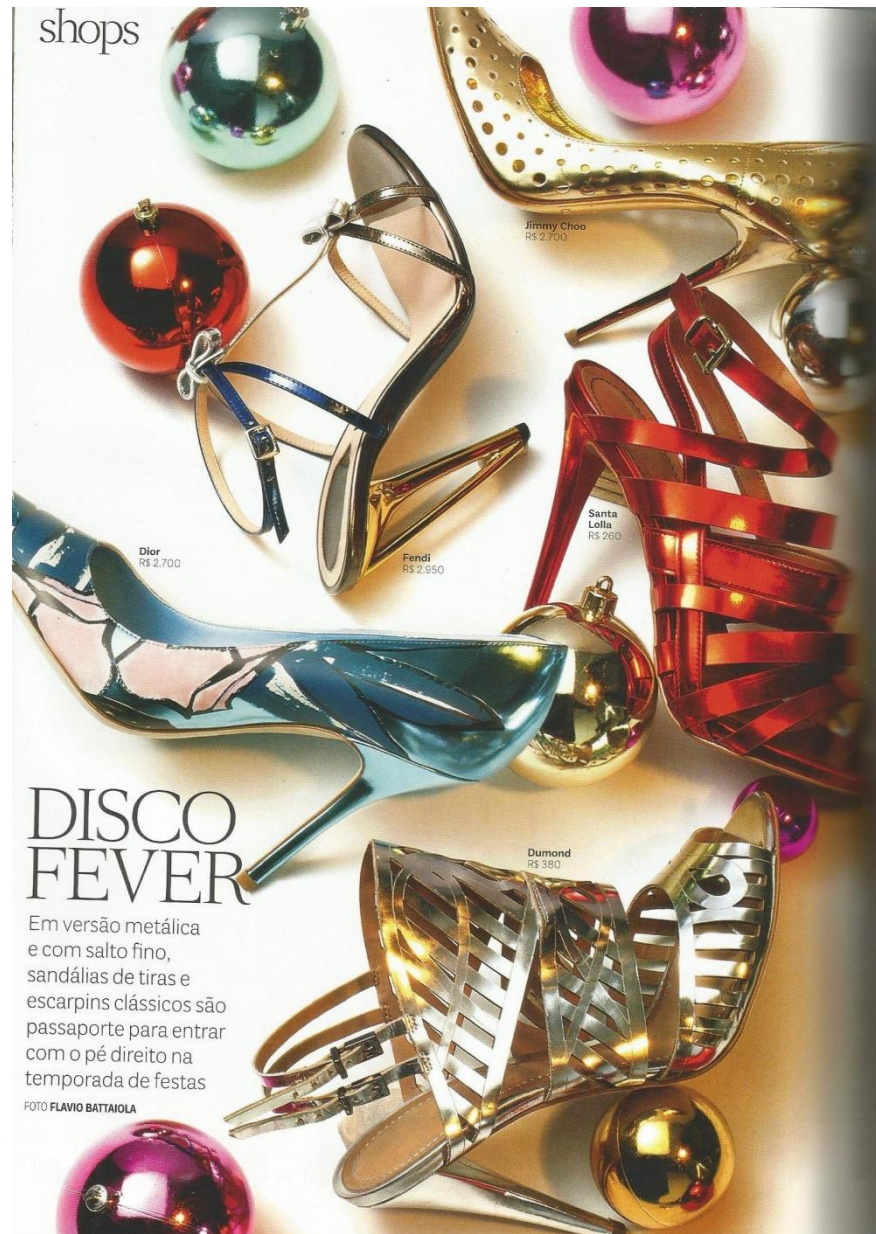
Figura 14: Shops

As cores metalizadas tornaram-se tendência e são utilizadas especialmente em acessórios, com mais frequência em sapatos e bolsas. Intitulada “Disco Fever”, Vogue traz o universo das discotecas das décadas de 70 e 80, onde os metalizados e brilhos eram os grandes protagonistas. Como uma forma de metáfora, a revista traz esse título como forma de trazer este universo ao ano de 2014.