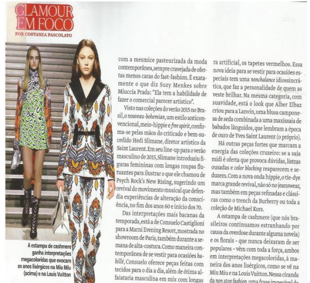
A estampa de cashmere ganha interpretações megacoloridas que evocam os anos lisérgicos na Miu Miu (cima) e na Louis Vuitton

ções de resort também servem para agregar à imagem das grifes influentes mais glamour e desejo, graças a desfiles com produções milionárias, que revivem o espírito da fashionista globe-trotter: a Chanel fez o seu em Dubai; a Dior num antigo estaleiro da Marinha americana no Brooklyn (Nova York); a Louis Vuitton em Monte Carlo. Até Miuccia Prada, que há três anos não desfilava o resort da Miu Miu, aproveitou a semana de alta-costura em Paris para apresentar uma seleção croisire em jantar estrelado, com direito a show do guitarrista Jack White (ex-White Stripes) e Roman Polanski e Uma Thurman na plateia.