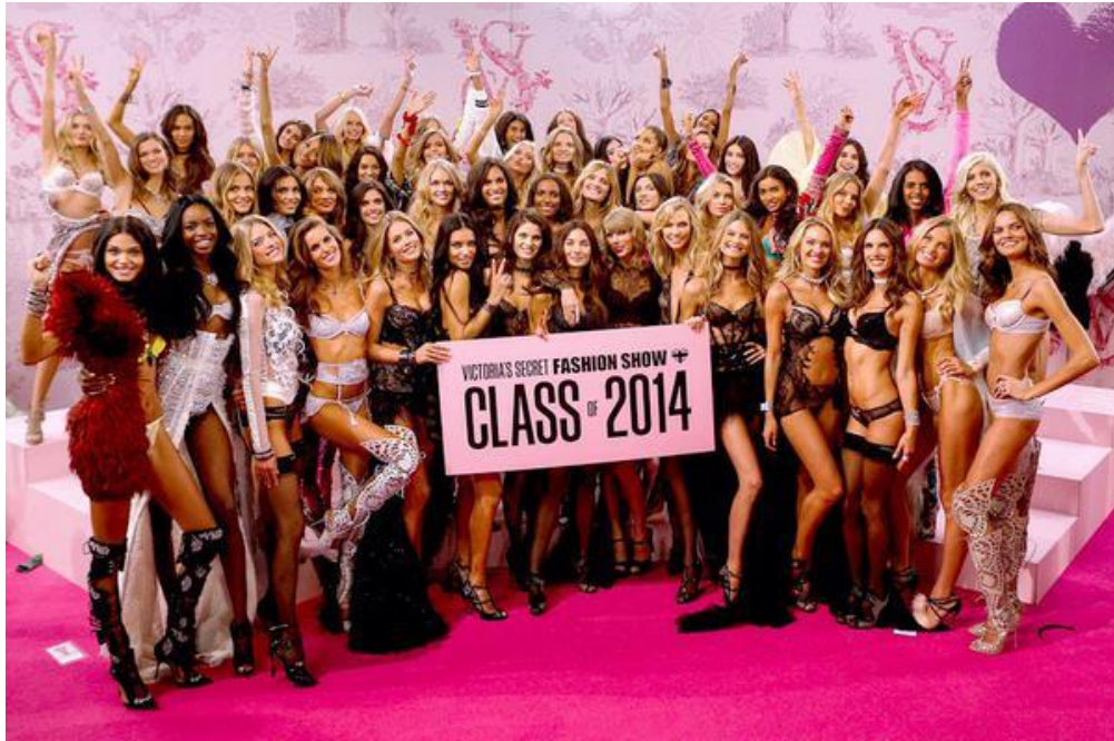
Figura 1 - As principais modelos do mundo reunidas no Victoria's Secrets Fashion Show , considerado um dos desfiles mais aguardados do ano, reunindo também grandes personalidades midiáticas.