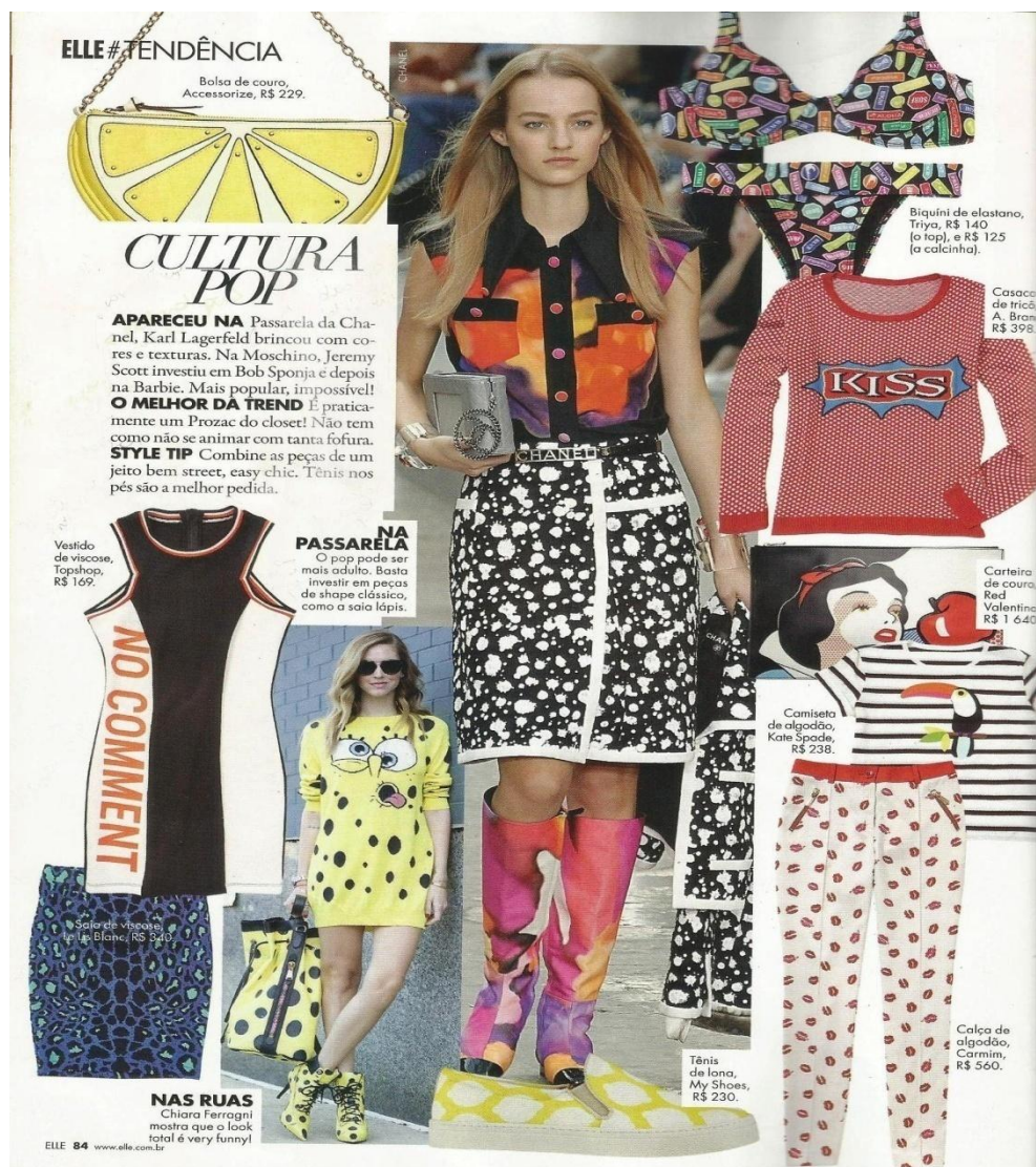
Figura 18: ELLE #tendência

Nesta seção, intitulada ELLE #TENDÊNCIA , a revista do mês de dezembro de 2014 nos traz cinco páginas com as tendências apresentadas durante as semanas de moda internacional. ELLE adota a mesma forma simbólica, através da diagramação, como forma de mostrar as tendências. A revista segue com os elementos expostos como uma vitrine em suas páginas, imagens das passarelas e também das ruas na intenção de legitimá-la. A primeira página traz a tendência que faz referência à CULTURA POP e é, desta forma, que ela é intitulada por ELLE.