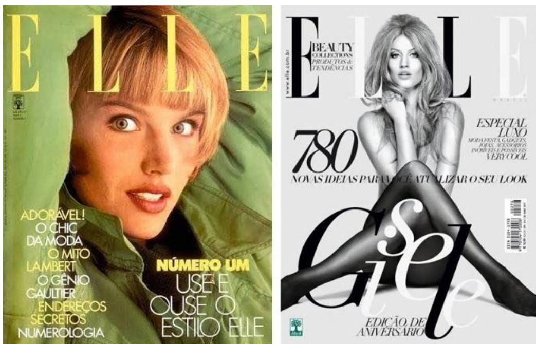
Figura 4 – Capas ELLE