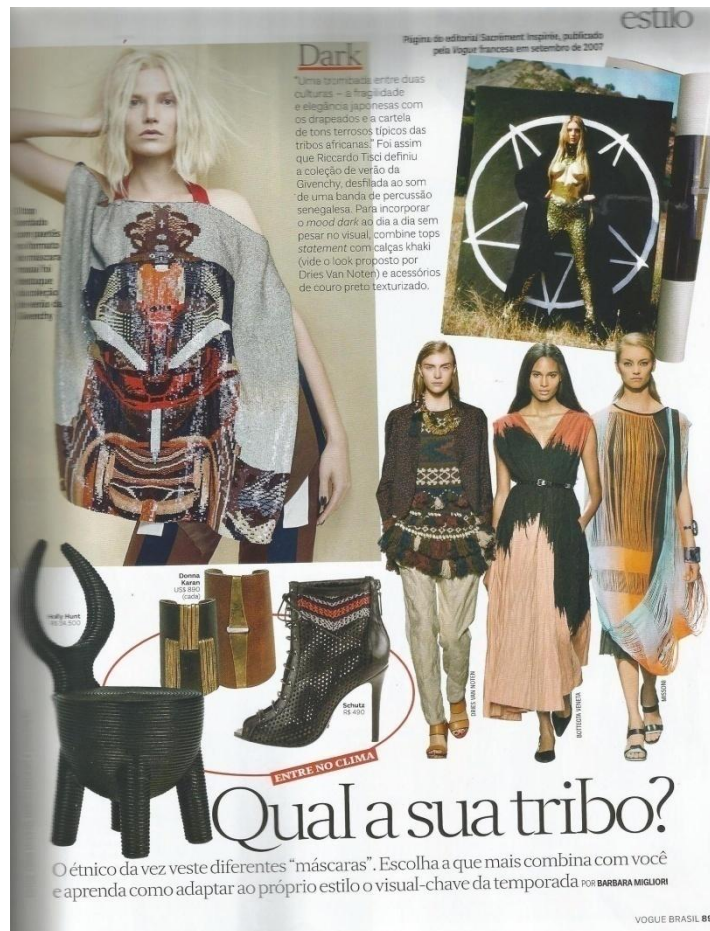
Figura 10: Estilo

Vogue cria um discurso voltado para apresentar as três formas de usar a tendência étnica. Para isso, ela explana a forma que as marcas apresentam esse universo de referência boho , dark e artsy , seja por meio de tecidos, formas, cores e atitude. A técnica de apresentar discursivamente a tendência traz, por meio de imagens, o reforço da ideia incutida. O leitor depara-se com imagens da passarela – como confirmação da origem da tendência - com elementos que podem ser usados para compor o visual étnico e fashionistas trazendo para o cotidiano essas tribos trazidas por Vogue. A noção de tribo pode ser vista, ideologicamente, como naturalização da tendência, uma vez que, fazer uso de peças de sua tribo, é algo totalmente natural.