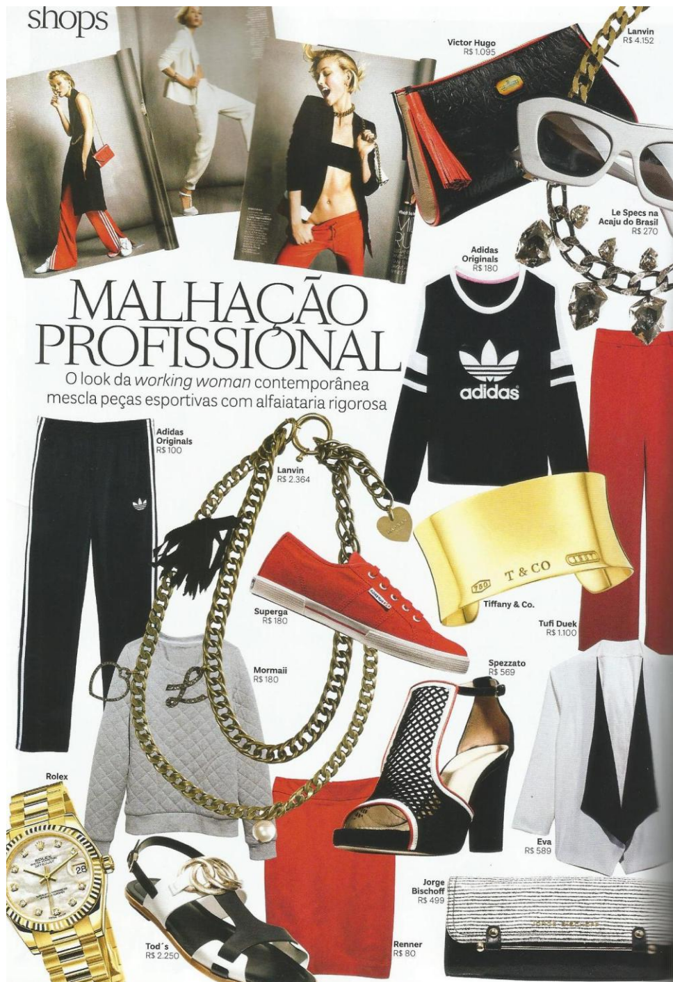
Figura 13: Shops

Como forma de seduzir o seu leitor, Vogue compõe esta página com diversos produtos que remetem à tendência trazida por ela e apresentadas por marcas nacionais e internacionais. Com diversos tipos de produtos, as pessoas se identificam com aqueles que mais se aproximam com seu estilo e personalidade. O intuito da tendência em questão é fazer com que