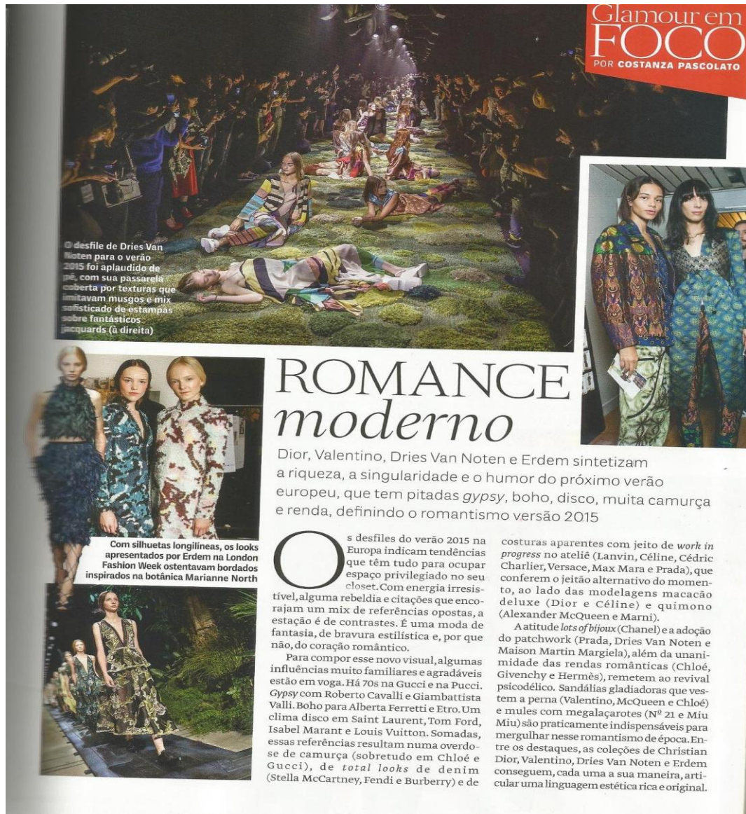
Figura 7: Glamour em foco

No que se refere à ideologia e como ela opera nos discursos acerca de tendência, analisaremos a coluna de Constanza Pascolato do mês de dezembro de 2014. Nesta figura de nº 7, a consultora de moda traz as tendências de verão trazidas pelas marcas internacionais.