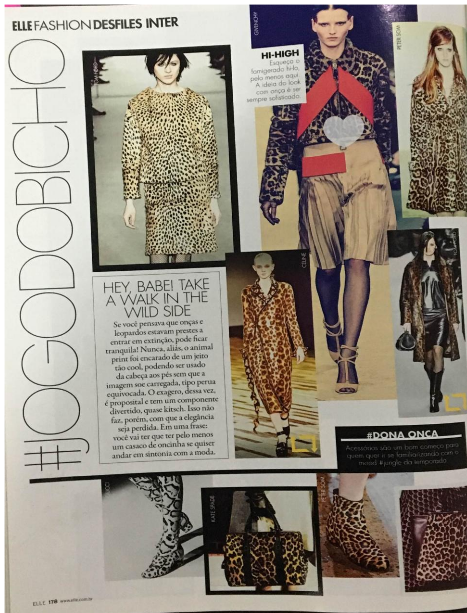
Figura 27: ELLE fashion desfiles inter

A revista apresenta a tendência por meio da metáfora “#jogodobicho”, fazendo alusão ao animal print , termo usado no círculo da moda pra designar as estampas que tenham traços de bichos. No que se refere à universalização, não iremos nos restringir somente a tendência em si, mas seu universo discursivo, como no caso do convite da revista em inglês “ Heym babe! Take a walk in the wild side ” 21 (ELLE, 2014, p. 178). A expressão em inglês nos remete também a noção da tecnologização e da comodificação do discurso. A revista se apropria de uma liguagem que lhe é própria para tornar universal uma tendência trazida de