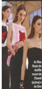
As filhas finais do desfile resort da Chanel (acima) e da Dior