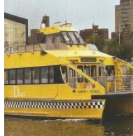
Três superproduções da temporada resort 2015: a balsa da Dior, no Brooklyn; o cubo de vidro de Mônaco; e as tendas da Chanel em Dubai