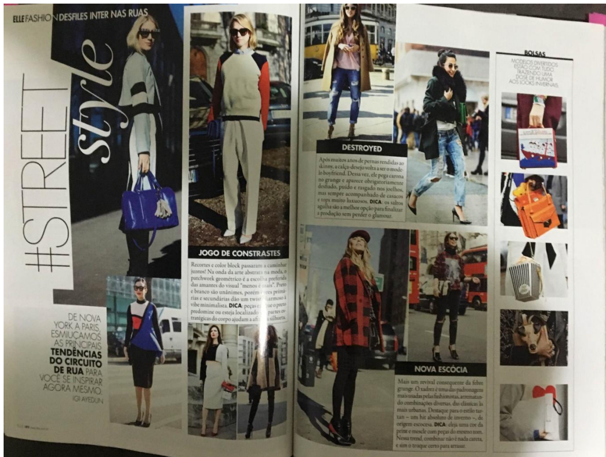
Figura 28: ELLE fashion desfiles inter nas ruas

Nesta seção, que aparece, estrategicamente, após a anterior, a revista aposta nas tendências apresentadas nas ruas como forma de universalização. “De Nova York a Paris, as principais tendências do circuito de rua para você se inspirar agora mesmo” (ELLE, 2014, p. 180). ELLE faz um passeio pelo circuito internacional a fim de fazer uma espécie de avaliação do que vem sendo usado nas ruas pelos personagens de moda.