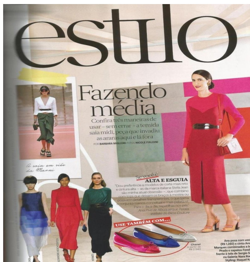
Figura 8: Estilo

A primeira tendência trazida pela revista são as saias midi, aquelas com comprimento maior que, geralmente, ficam abaixo dos joelhos. Vogue classifica essa peça de roupa como “ temida ”, por ser o tipo que requer bastante cuidado na hora de compor o visual. A revista ensina três maneiras de utilizá-las, a partir do tipo físico de cada mulher e também da personalidade e identidade.