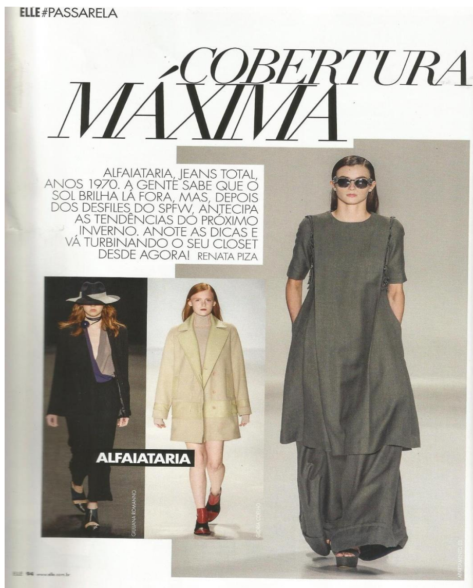
Figura 26: ELLE #passarela

ELLE traz para esta seção uma das tendências que será referência durante o inverno brasileiro. Intitulada de “cobertura máxima”, a revista apresenta diversas maneiras de usar um dos itens que mais apareceram nos desfiles que foram os casacos e tricôs. Entretanto, ela apresenta outras peças, como por exemplo, o vestido, produzido com tecidos que garantam esta cobertura, como uma alternativa ou peça-chave para a estação.