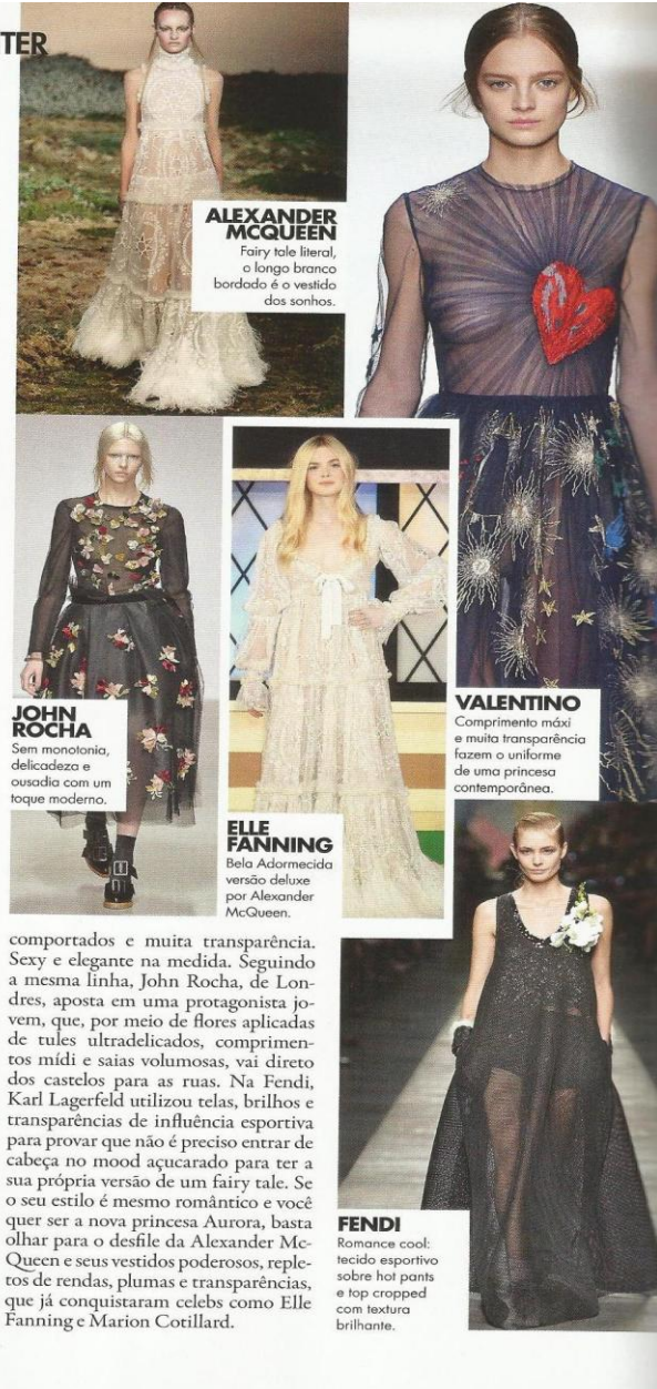
ALEXANDER MCQUEEN Fairy tale literal, o longo branco bordado é o vestido dos sonhos.

Não é de hoje que a moda flerta com o cinema, especialmente com a onda de remakes de contos de fadas, como Branca de Neve e o Caçador, Espelho, Espelho Meu e A Garota da Capa Vermelha , que estourou no ano passado. Na época, os figurinos de encher os olhos saltaram das telas às passarelas e o que vimos foi um verdadeiro exército de princesas modernas desfilando pelas ruas ao redor do globo. Agora, graças ao novo hit cinematográfico Malévola – que conta a história da Bela Adormecida sob o ponto de vista de sua vilã –, muitos designers mergulham novamente no universo desses reinos encantados para criar vestidos deslumbrantes e uma série de looks dignos de rainhas dos tempos modernos. Uma Chapeuzinho Vermelho sutil apareceu na passarela da Dolce & Gabbana, com direito a muitas prints florais e até um luxuoso capuz de pele. Na vida real, o vestido fluido vai bem em festas e casamentos, além de ser uma ótima pedida para quem curte um visual boho chic. Ainda no tema floral, mas dessa vez com bordados preciosos, a dupla Maria Grazia Chiuri e Pierpaolo Piccioli, da Valentino, apresentou aquela que talvez seja a roupa perfeita para uma princesa contemporânea: mangas compridas, comprimentos longos, decotes