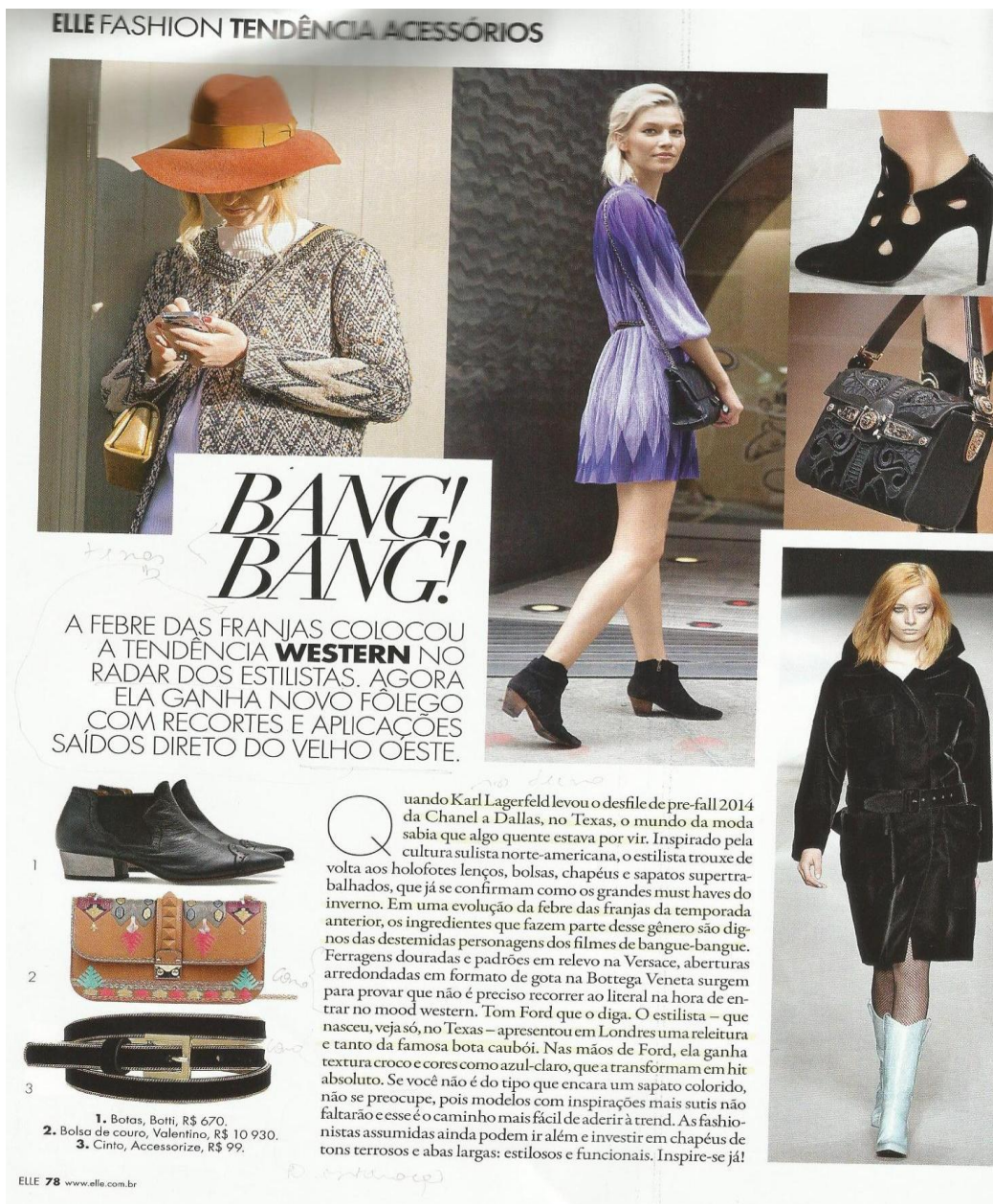
Figura 25: ELLE fashion tendência acessórios