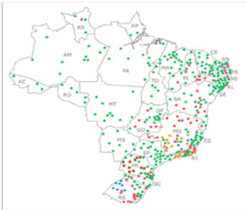
Figura 2 – Total das Unidades da Rede Federal de Educação Profissional e Tecnológica - Brasil