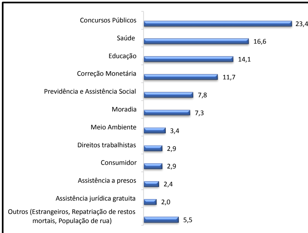
Gráfico 1 – Tipo de Direito Reclamado

Verificou-se a predominância de questões relativas a seleções e concursos públicos. Nesta categoria, apareceram questões relativas a concursos, como o questionamento da inexistência de previsão de isenção de taxa de inscrição para pessoas de baixa renda e acerca de critérios considerados discriminatórios nos processos seletivos (como idade, estado civil, estado de aposentado), entre outros.