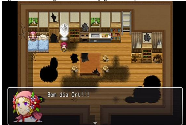
Figura 2: Personagens iniciais do jogo e interação com o ambiente

direcionados e orientados pelos personagens. São interações específicas iniciais que ajudam a entender a dinâmica de jogo escolhido, como os jogos de RPG clássicos.