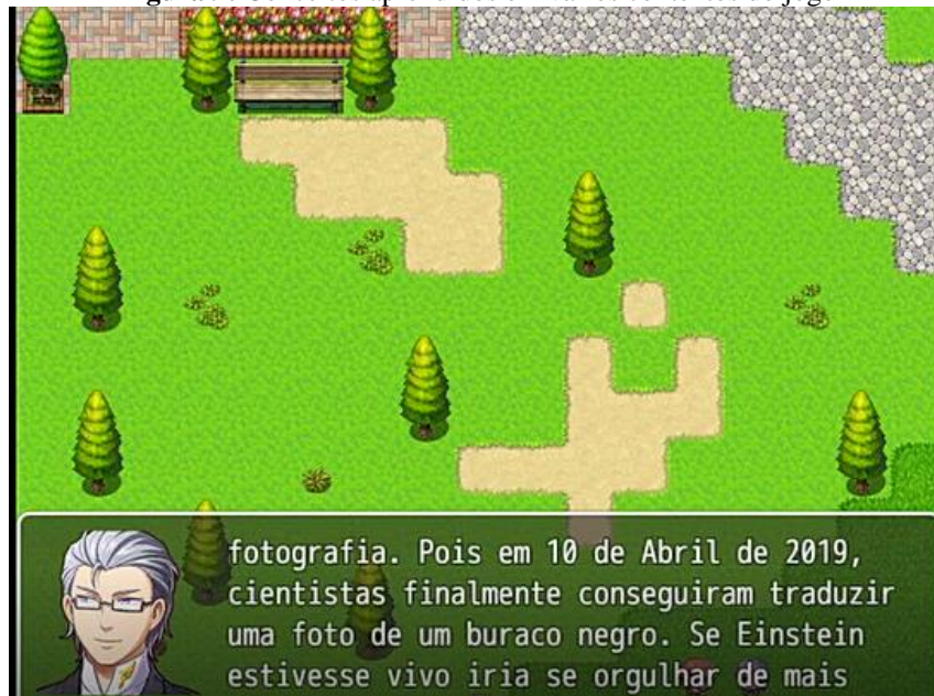
Figura 9: Conceitos aprendidos em vários contextos do jogo