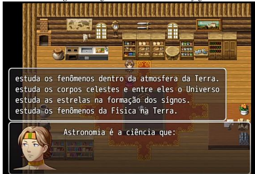
Figura 7: Perguntas sobre Astronomia no jogo