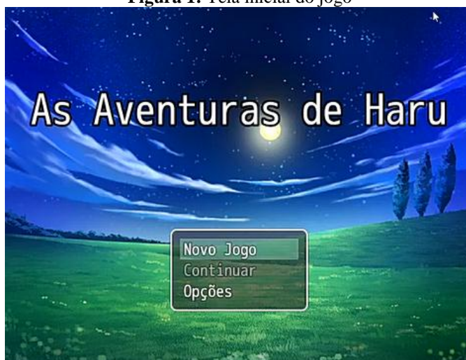
Figura 1: Tela inicial do jogo

Na tela de abertura do jogo existem as opções: para que o jogador entre em um novo jogo, continuar de onde parou, e também navegar nas opções de jogo.