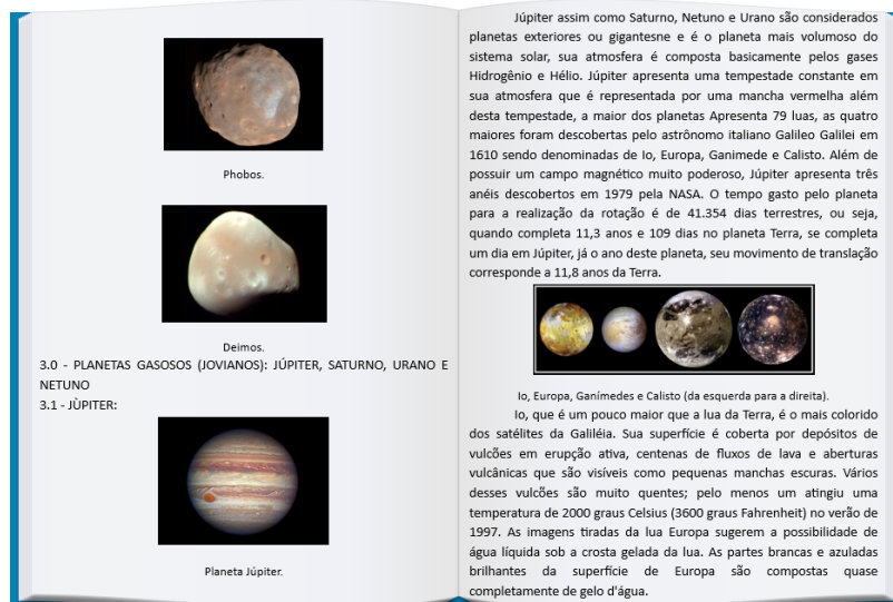
Figura 6: Imagem da visão do jogador em um livro no jogo

Na imagem seguinte têm-se os conteúdos de Astronomia em formato de livro contido no jogo: