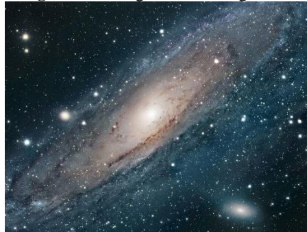
Figura 11: Imagem de nossa galáxia.