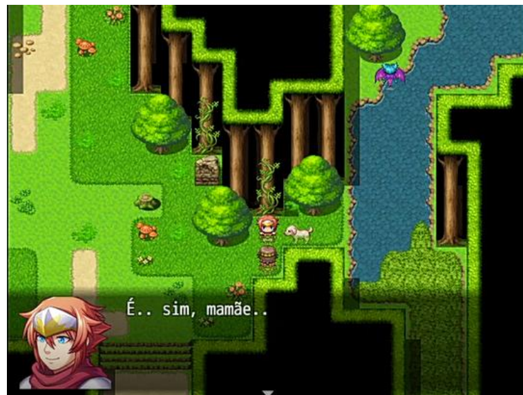
Figura 4: Interação de Haru com sua mãe

protagonismo das Aventuras de Haru. Logo no começo percebemos que nosso amiguinho está preocupado com o encontro marcado com sua mãe, ele olha no relógio (através de interação do jogador) e vê que está atrasado. Percebemos que existe uma relação bem forte de mãe e filho no que diz respeito à disciplina. E ao tentar encontrar sua mãe o jogador é induzido à querer ajudar um cachorrinho perdido que está perto de um inimigo feroz. Na batalha o jogador é derrotado intencionalmente, mas imediatamente chega a mãe de Haru o salvando e logo em seguida dando-lhe sermões sobre a irresponsabilidade dele de lutar assim despreparado.