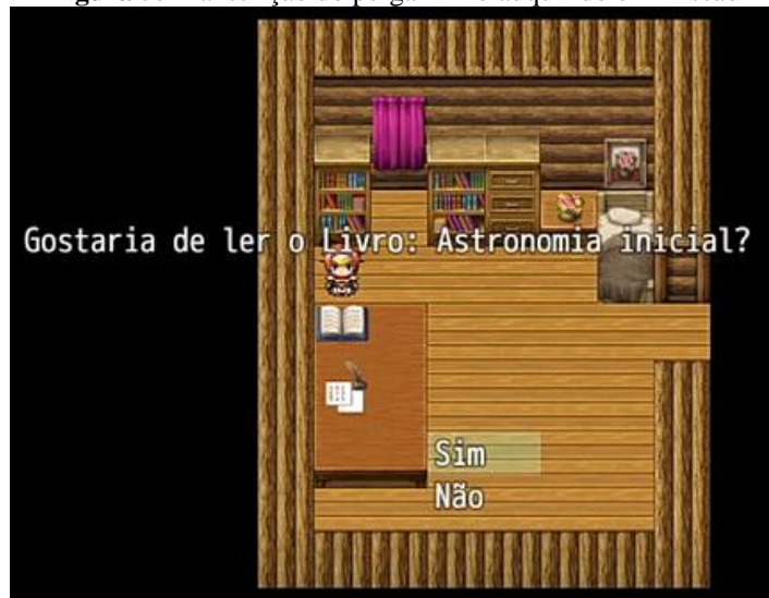
Figura 5: Transcrição do pergaminho adquirido em missão