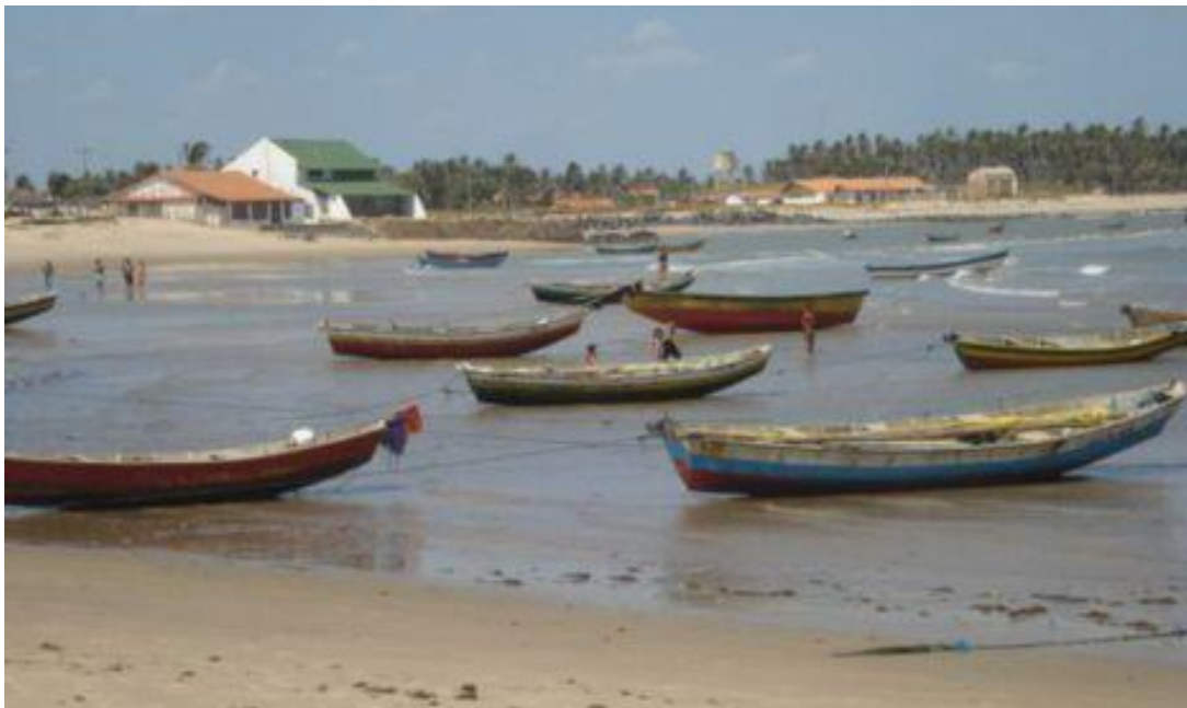
Figura 5: Praia de Pedra do Sal, 2000.

Então, esse é o cenário presente no litoral piauiense, de um lado o grande investimento de uma empresa eólica, de outro lado a comunidade que recebe o empreendimento, sendo atingida por externalidades, além da presença da figura do Estado, que busca o incentivo para desenvolver a economia da região.