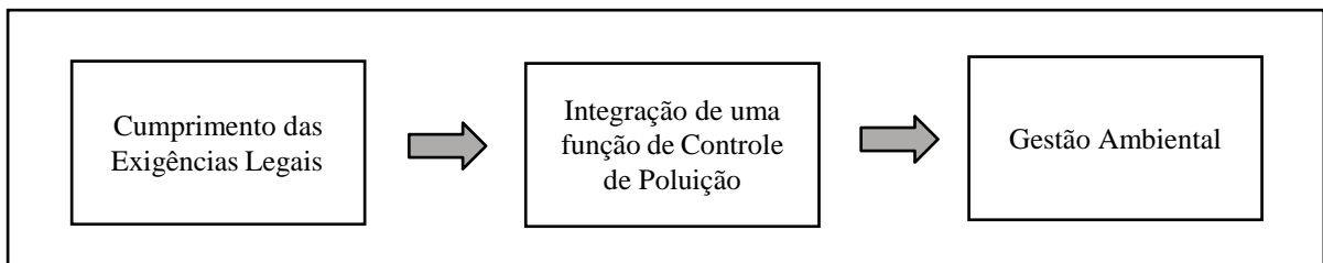
Figura 1 – Evolução da Questão Ambiental nas Empresas

Posteriormente, as Empresas buscaram compor a atividade de controle ambiental em suas funções gerenciais para aperfeiçoar e acompanhar todos os processos produtivos a fim de minimizarem os efeitos e prevenirem as práticas poluidoras e impactantes ao meio ambiente, desde a seleção da matéria-prima, fornecedores, produtos menos nocivos à saúde até a integração da empresa com o meio interno e externo a organização, aprimorando uma atitude empresarial mais ativa e criativa, onde surgiu a Gestão Ambiental. Como mostrado (figura 1) abaixo: