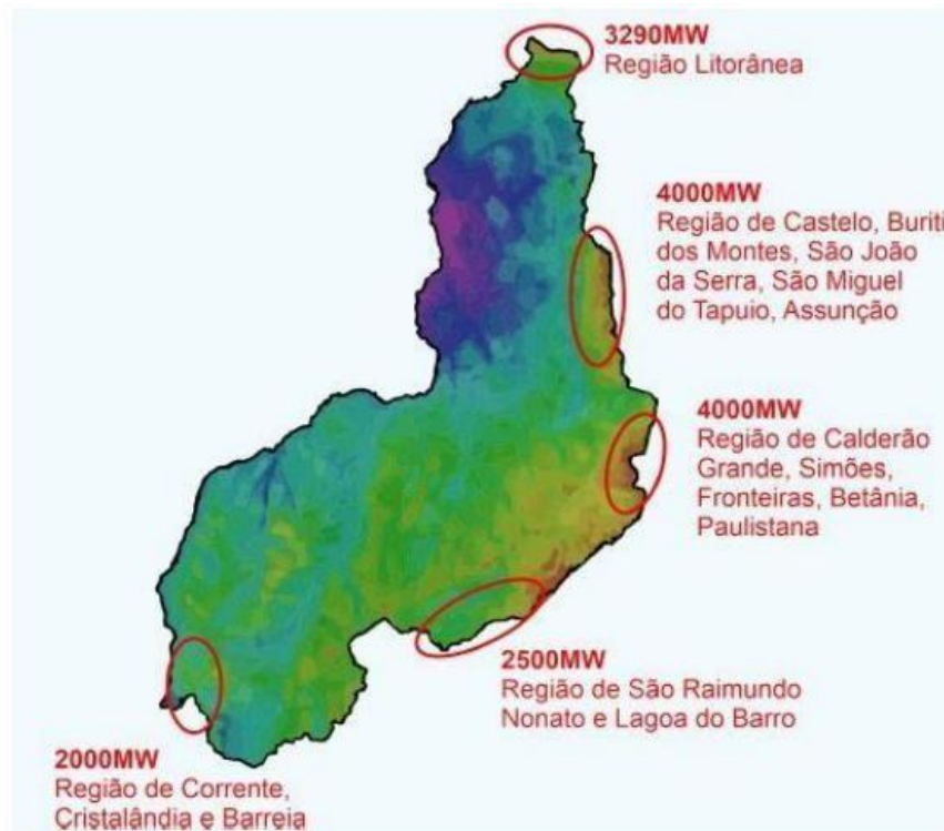
Figura 3 : Potência eólica instalada nos estados brasileiros - Casa dos Ventos 2019.

A energia eólica terminou o ano de 2020 com 686 usinas e 17,75 GW de potência eólica instalada, o que representou um crescimento de 14,89 % de potência em relação a dezembro de 2019, quando a capacidade instalada era de 15,45 GW. Em 2020, foram instalados 66 novos parques eólicos e outros 14 foram repotenciados, num total de 2,30 GW de nova capacidade. Devido à pandemia, o ano de 2020 foi claramente cheio de desafios para todos, incluindo o setor de energia (ABEEÓLICA, 2021).