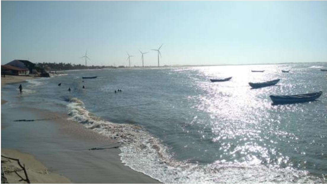
Figura 6: Praia Pedra do Sal, 2016.