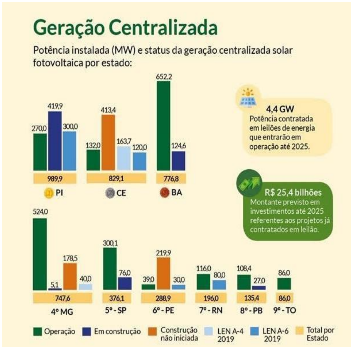
Figura 4: Geração Centralizada energia Solar. Fonte: ANEEL/ABOLAR, 2019.

etapa do projeto começou a operar ainda em 2020. Agora, a primeira expansão de 133 MW do parque está sendo finalizada – mantendo a posição de maior usina de energia solar do Brasil e da América do Sul. Ao alcançar 608 MW, o parque terá capacidade para gerar mais de 1.500 GWh por ano, evitando a emissão, anual, de mais de 860 mil toneladas de CO 2 .