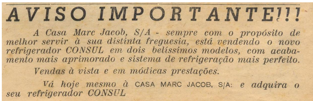
Figura 11: Propaganda Casa Marc Jacob

A Casa Marc Jacob, S/A – sempre com o propósito de melhor servir à sua distinta freguesia, está vendendo o novo refrigerador CONSUL em dois belíssimos modelos, com acabamento mais aprimorado e sistema de refrigeração mais perfeito. Vendas à vista e em módicas prestações. Vá hoje mesmo à CASA MARC JACOB, S/A: e adquira o seu refrigerador CONSUL. 256