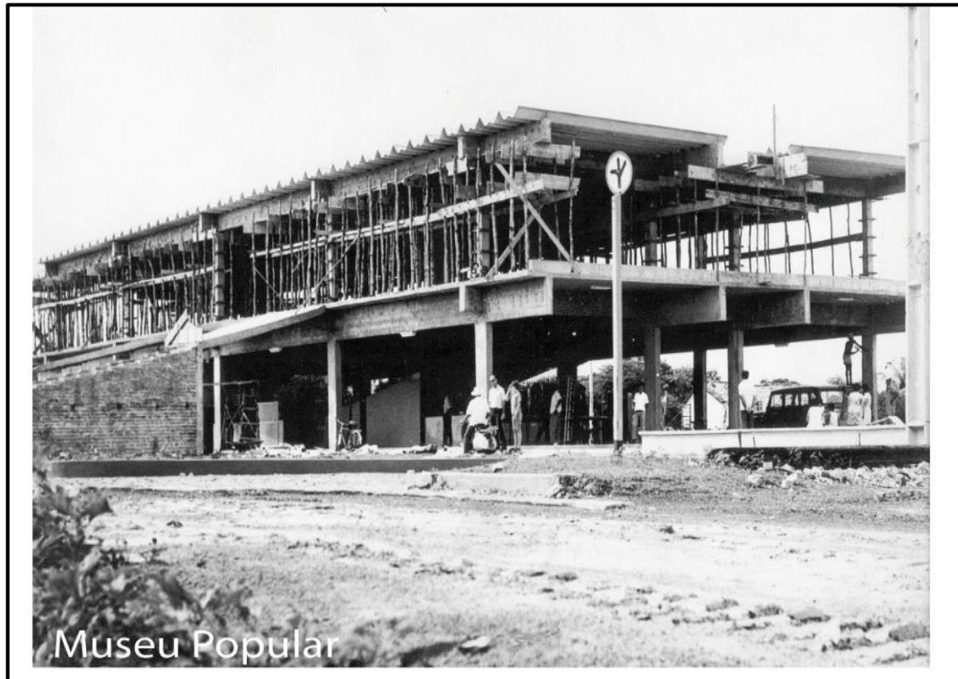
Figura 7: Terminal Rodoviário em fase de construção.

desembarque de passageiros, também, um lugar de sociabilidades, tendo em vista a quantidade de espaços que poderiam usufruir.