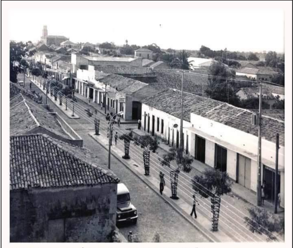
Figura 6: Avenida Demerval Lobão.

Outras fotografias produzidas no mesmo período reproduzem essa dimensão, representando uma cidade limpa, arborizada, higienizada, como pode ser vista na figura 6, que exhibe uma fotografia datada do início da década de 1970, que retrata a avenida Demerval Lobão.