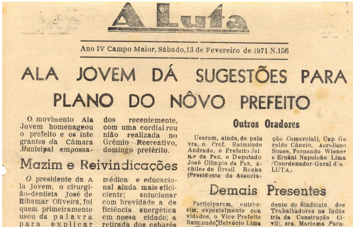
Figura 4: Matéria do jornal A Luta de 1971.

Fonte: ALA jovem dá sugestões para plano do nôvo prefeito. A Luta . Campo Maior, p. 1, 13 fev. 1971.