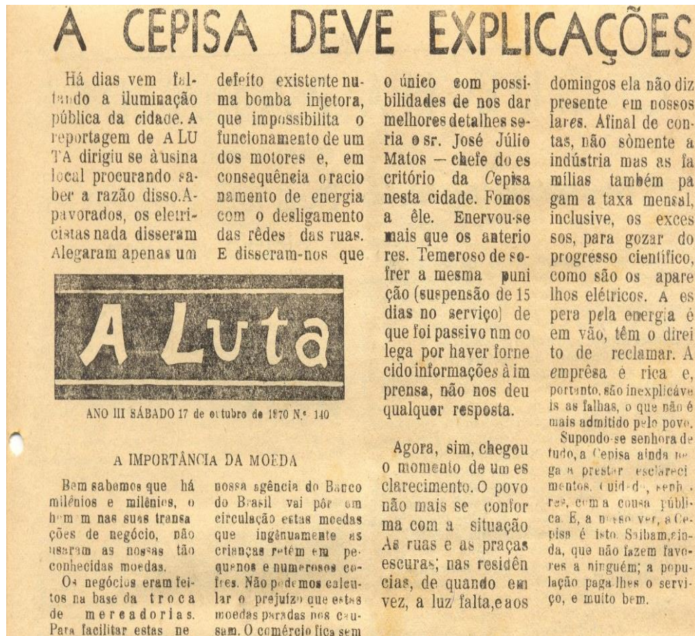
Figura 10: Matéria do jornal A Luta