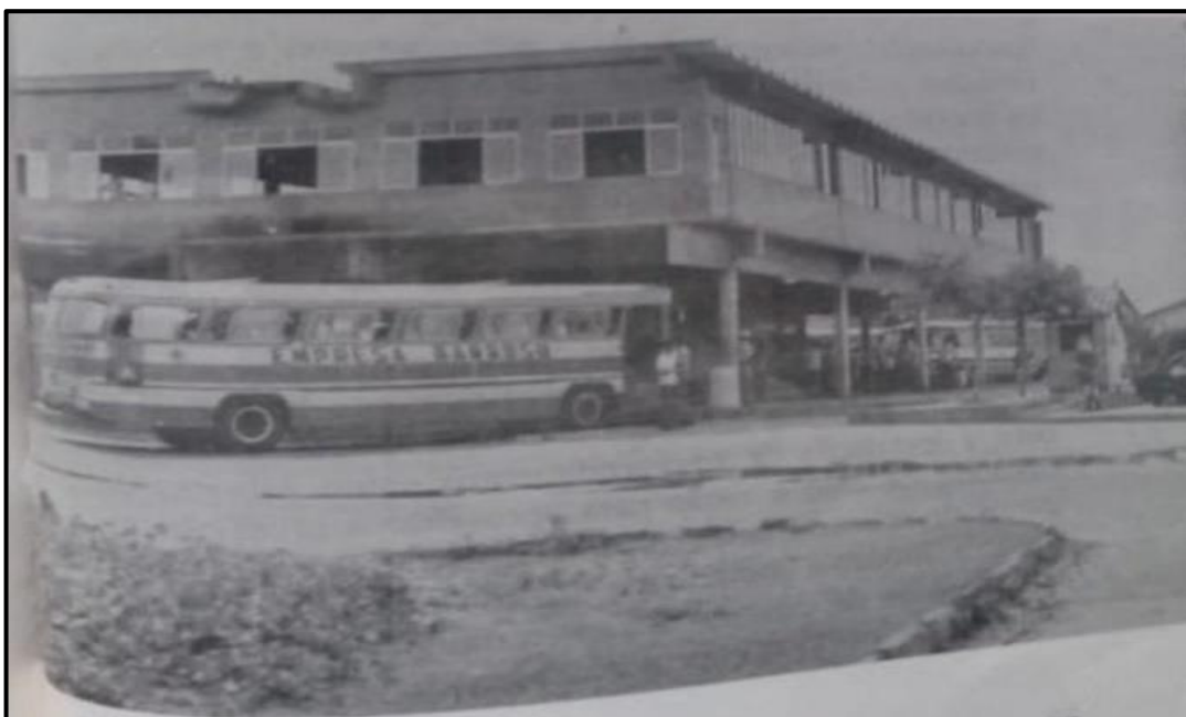
Figura 8: Terminal Rodoviário década 1970.