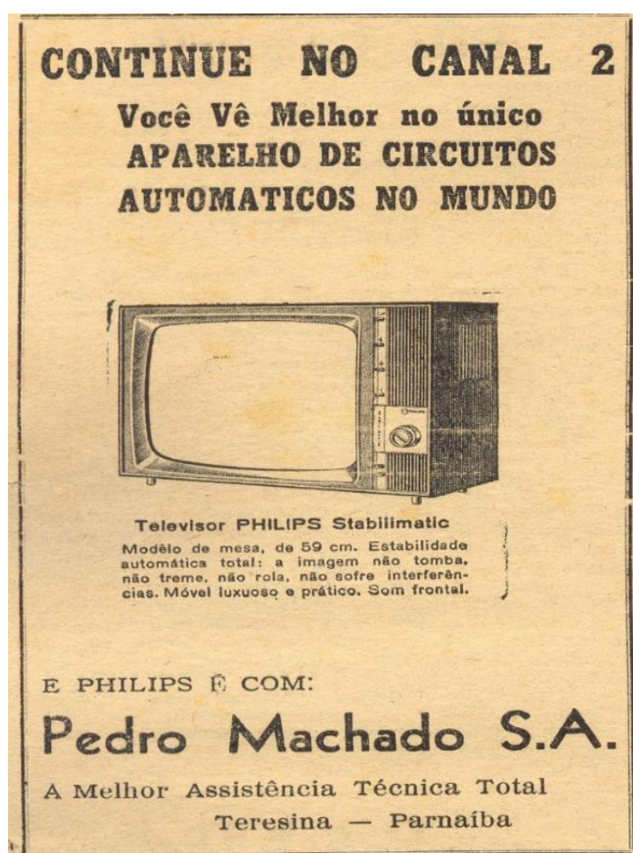
Figura 13 Propaganda Lojas Machado S.A.

As propagandas das lojas localizadas na cidade de Campo Maior não usavam imagens, somente a descrição dos produtos à venda, geralmente com frases que tornavam os produtos atrativos para o consumidor. Em contrapartida, as propagandas das lojas Pedro Machado S/A, localizadas nas cidades de Teresina e Parnaíba, utilizavam imagens para anunciar aparelhos de televisão, como mostra a figura 13.