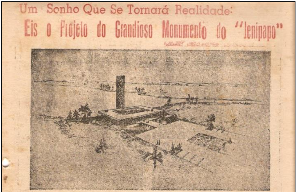
Figura 9: Projeto do Monumento.

O jornal A Luta , em 1973, anunciava com entusiasmo a imagem do projeto do monumento (figura 9), dando-lhe destaque na primeira página.