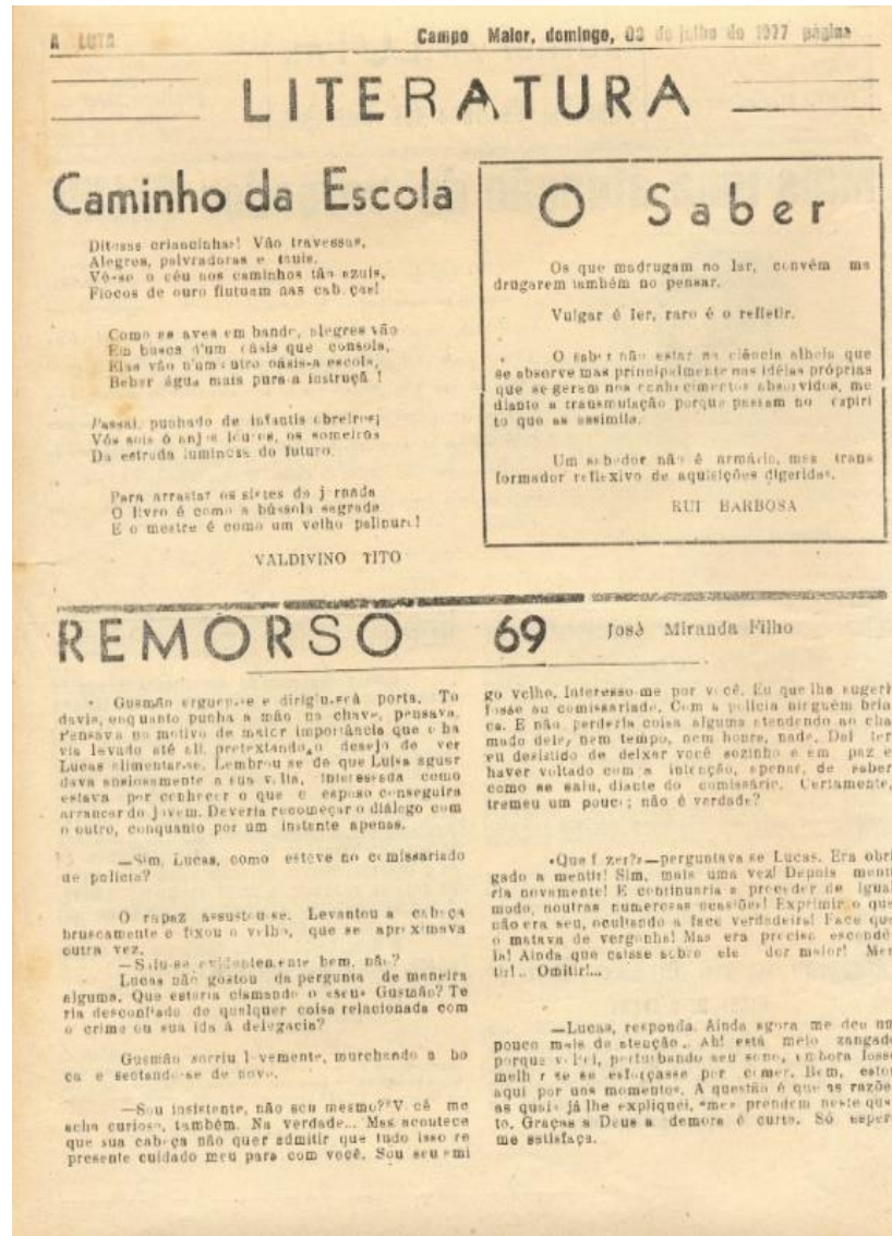
Figura 2: Página de publicações literárias de A Luta.

Durante a década de 1970, a energia elétrica e o abastecimento de água se tornaram uma das principais discussões nas páginas do jornal A Luta , tendo amplitude nas matérias jornalísticas, principalmente nas primeiras páginas. O jornal buscava mostrar os problemas enfrentados pela população, trazendo informações sobre as soluções que seriam realizadas em torno da falta de energia elétrica. Além das reportagens, as diversas colunas do jornal mostravam a opinião dos leitores sobre esses problemas. Durante o referido período, destacavam-se as colunas “O povo reclama” e “Problemas que clamam soluções” dedicadas, especialmente, para as denúncias feitas pela população sobre inúmeros problemas no município.