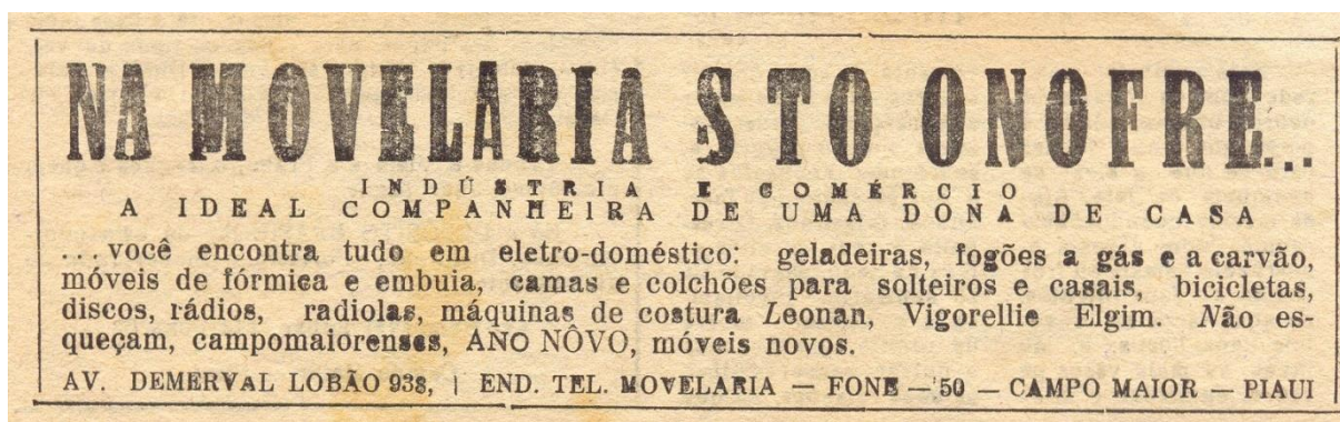
Figura 12: Propaganda Movelaria Santo Onofre.

...você encontra tudo em eletro-domésticos: geladeiras, fogões a gás e a carvão, móveis de fórmica e imbuia, camas e colchões para solteiros e casais, bicicletas, discos, rádios, radiolas, máquinas de costura Leonan, Vigorellie Elgim. Não esqueçam, campomaiorenses, Ano Nôvo, móveis novos. 259