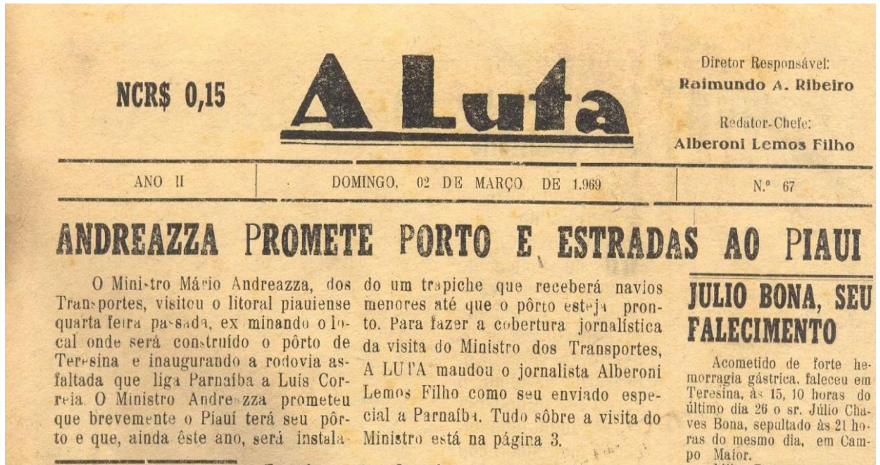
Figura 5: Manchete do jornal A Luta.