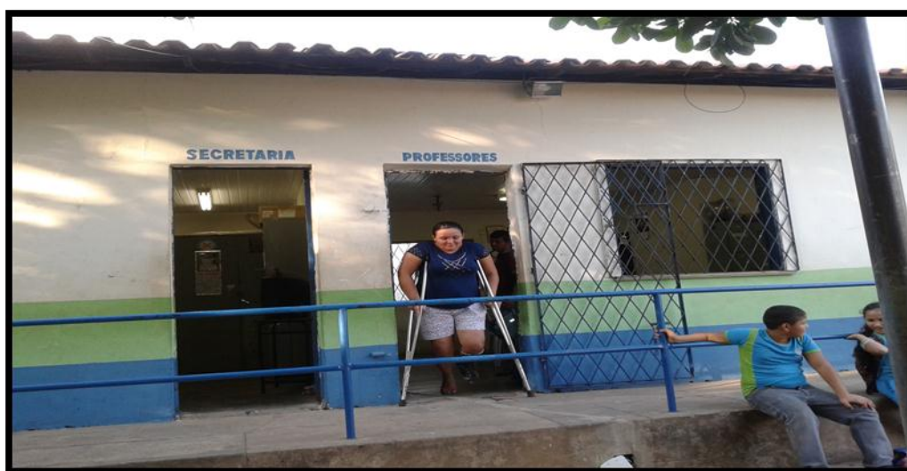
FIGURA 05- ESCOLA MUNICIPAL SÃO SEBASTIÃO

A escola recebe apoio de alguns programas/projetos do Ministério da Educação: Programa Mais Educação, Projeto Escola Aberta, Projeto Segundo Tempo (com atividades esportivas) destinados ao ensino fundamental de 6º ao 9º anos e o Programa ALFASOL. Além de recursos pedagógicos e materiais permanentes, a escola dispõe de: livros didáticos, paradidáticos, enciclopédicos, DVDs, mapas, globo, televisores, aparelho de DVD, datashow, notebook, caixa de som amplificada, micro sistem, geladeiras, freezers, dentre outros. Dando continuidade, vem a caracterização da Escola Municipal São Sebastião (FIGURA 05).