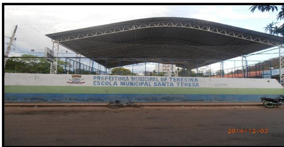
FIGURA 07- ESCOLA MUNICIPAL SANTA TERESA

Dentre os recursos pedagógicos e materiais disponíveis destaca-se: retroprojetores, TVs, DVDs, máquina fotográfica, computadores, Microsistemas, Notebook, mapas, globo digital e um acervo bibliográfico variado: livros didáticos, paradidáticos, enciclopédias, dentre outros. Enfim, apresenta-se a caracterização da última instituição pesquisada, a Escola Municipal Santa Teresa (FIGURA 07).