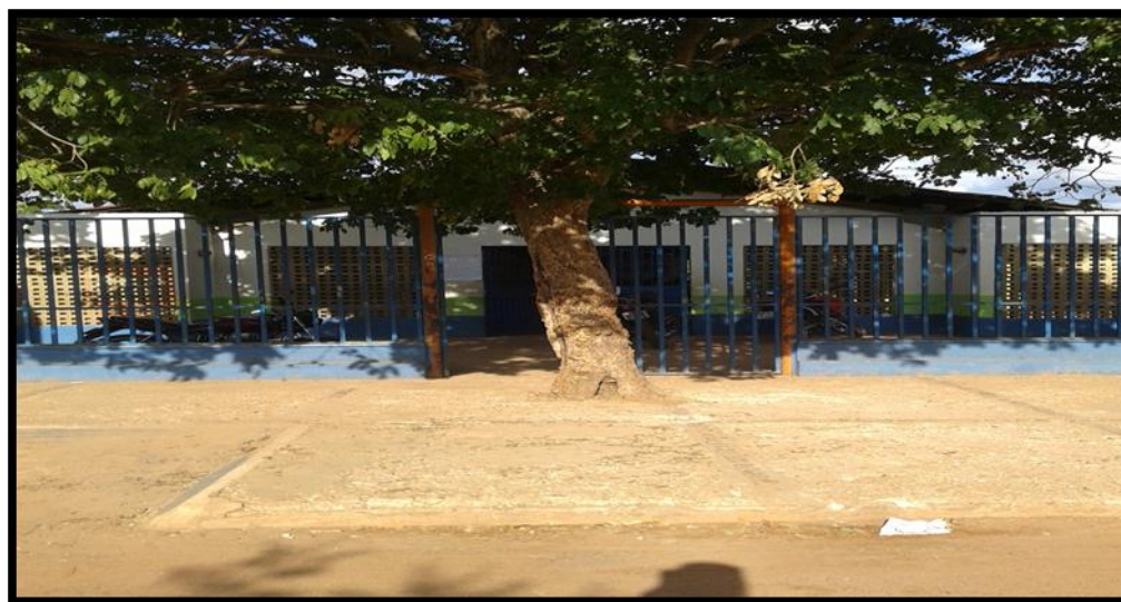
FIGURA 06: ESCOLA MUNICIPAL MARCÍLIO FLÁVIO RANGEL DE FARIAS