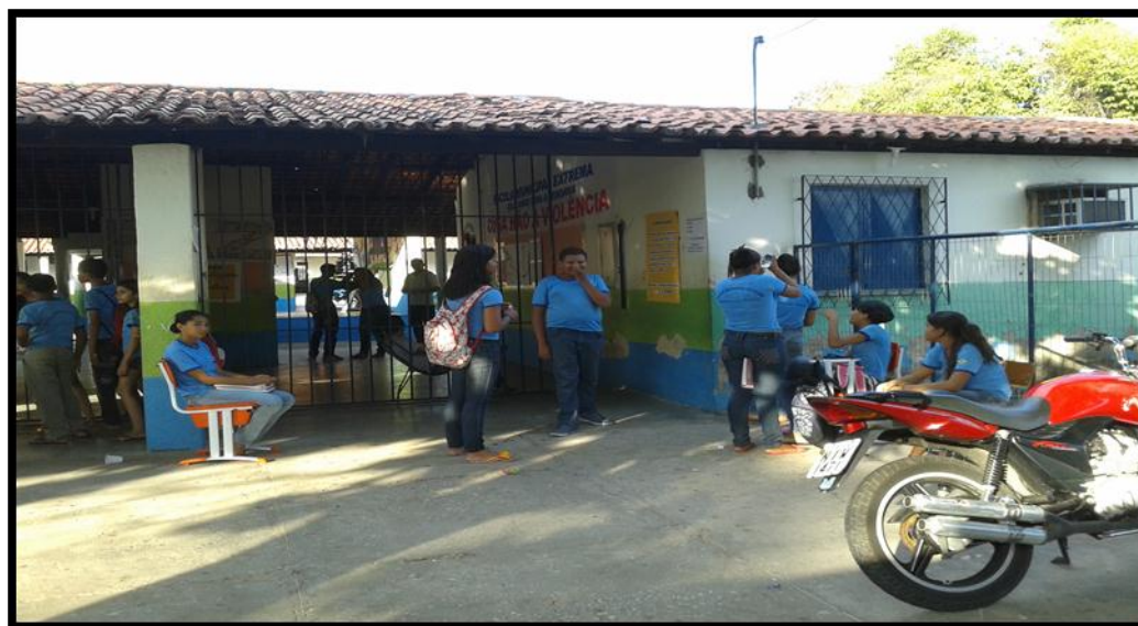
FIGURA 04- ESCOLA MUNICIPAL EXTREMA

Os recursos pedagógicos e demais materiais disponíveis na escola são: livros (didáticos, paradidáticos, enciclopédicos, DVD's etc.) mapas, globo, televisores, aparelho de DVD, data show, notebook, caixa de som amplificada, geladeiras, freezers, dentre outros. Continuando, apresenta-se a caracterização da quarta escola (FIGURA 04).