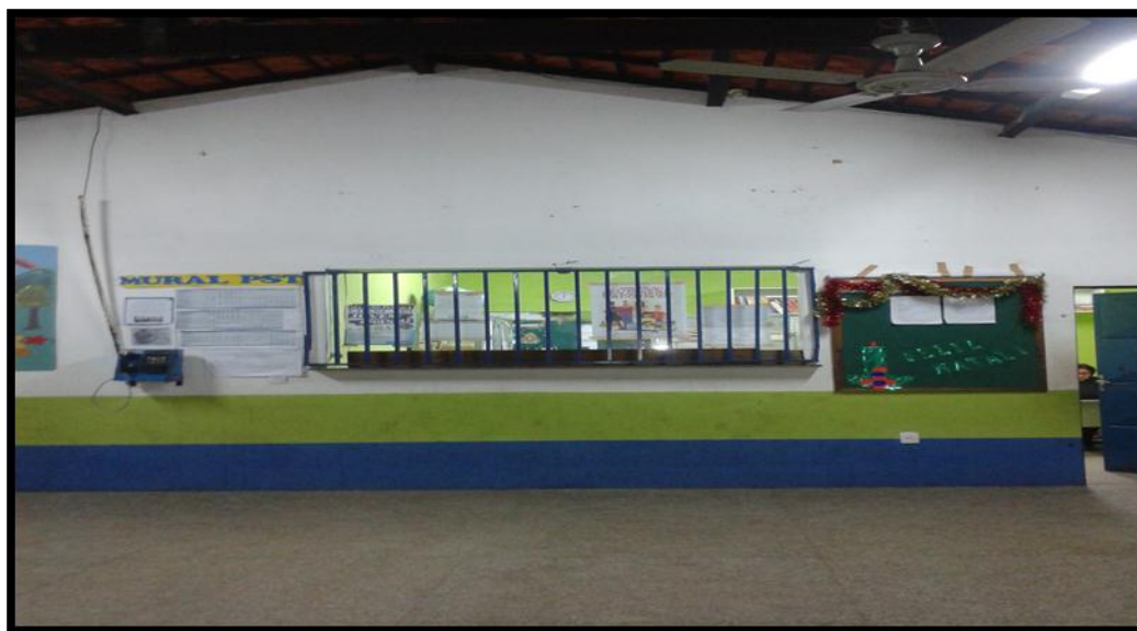
FIGURA 02 - ESCOLA MUNICIPAL SANTA FÉ