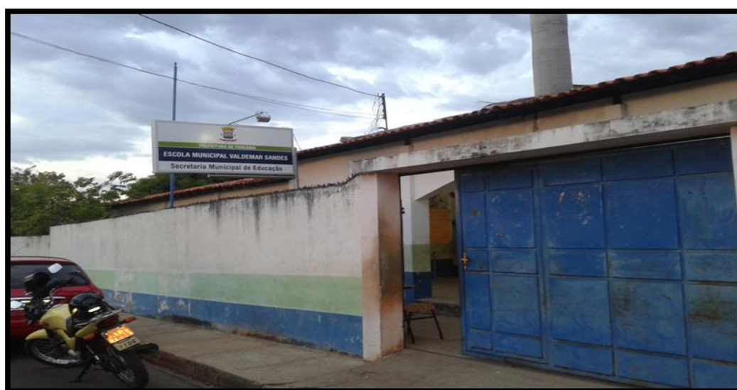
FIGURA 03- ESCOLA MUNICIPAL VALDEMAR SANDES

Conta com um rico acervo de livros paradidáticos e literatura infanto-juvenil; recursos pedagógicos: mapas, globo, data show, notebook, aparelhos de DVD, televisores, caixas de som amplificadas, microfones e filmadora; material permanente: geladeiras, freezers, impressoras, computadores, dentre outros. Continuando, passa-se a caracterização da Escola Municipal Valdemar Sandes (FIGURA 03).