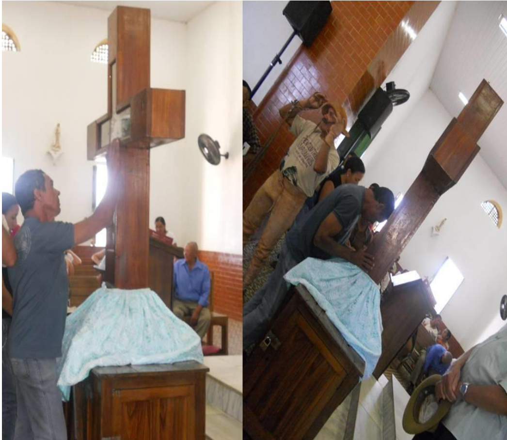
Foto 3: O “abraço” de Santa Cruz dos Milagres