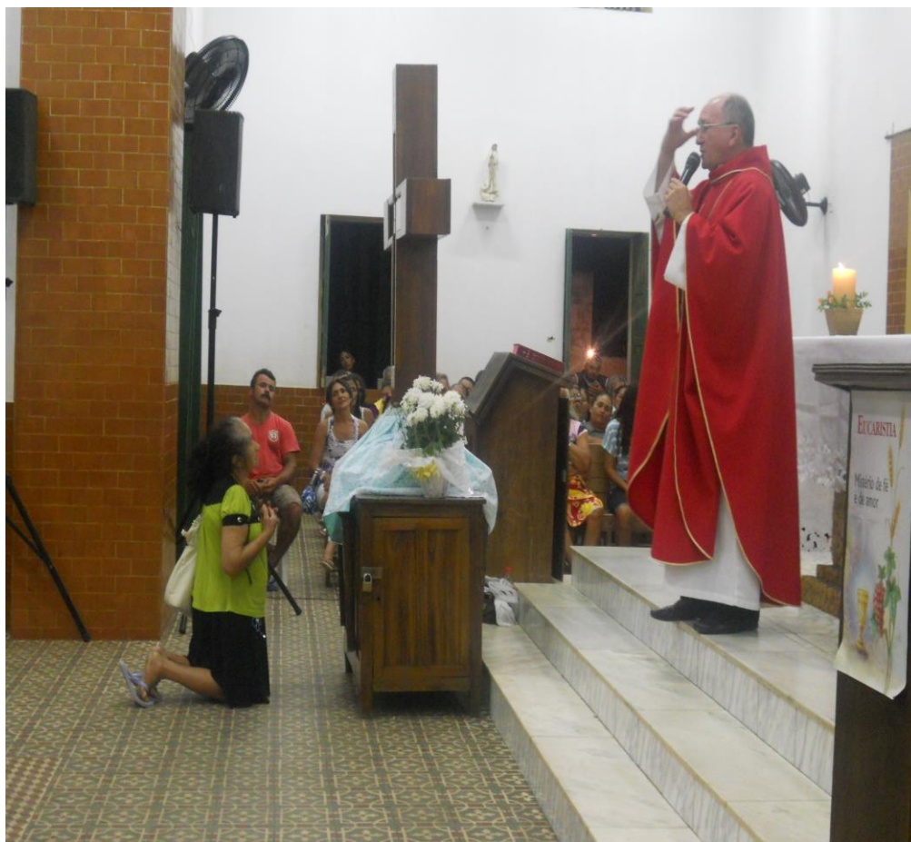
Foto 5: Adoração a Santa Cruz

A Adoração a Santa Cruz dos Milagres fica clara pela ação da senhora, que ignora a presença e recomendações dos animadores da missa para que a aproximação com a santa seja feita apenas no fim das liturgias, a senhora prostrada aos pés da santa parece absorva às recomendações e começa o seu diálogo com a santa, concentrada e contrita, assim como os outros devotos, que acostumados ao ato parecem ignorar a ação da senhora.