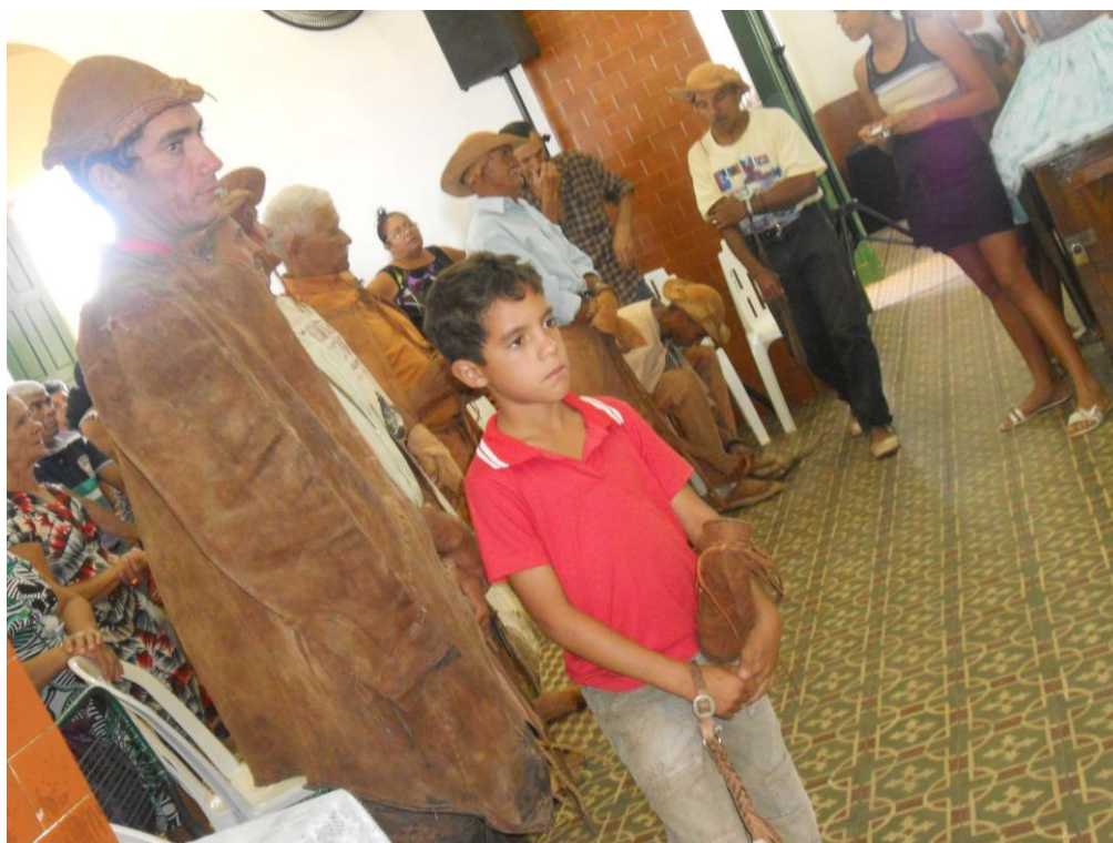
Foto 7: A criação de um novo vaqueiro