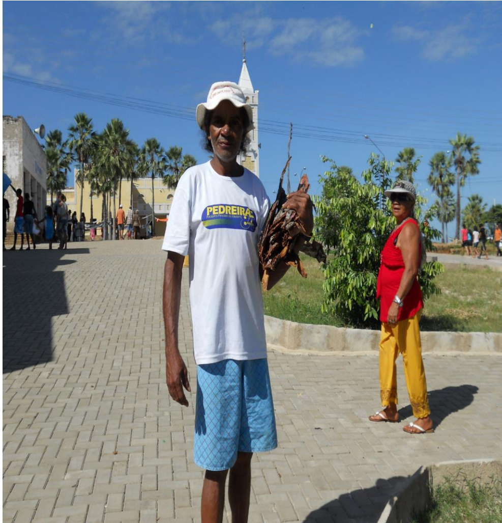
Foto 2: O “fornecedor” de chapada

Essa crença na cura que pode vir pela intervenção de Santa Cruz dos Milagres leva também ao desejo de ser protegido por ela, anseio que é percebido pelo olhar contemplativo dos devotos ou no desejo de afago, carinho, que se olharmos apuradamente, a santa parece ofertar aos seus devotos, que a admiram e abraçam de modo contrito e levam ao encontro com a santa parte da sua própria história, seus medos e desejos, e são antes de tudo parte da imagem da devoção. Tanto que algumas ações chegam a se repetir com personagens diferentes, mas com ações semelhantes, de beijar, ajoelhar e tocar a santa.