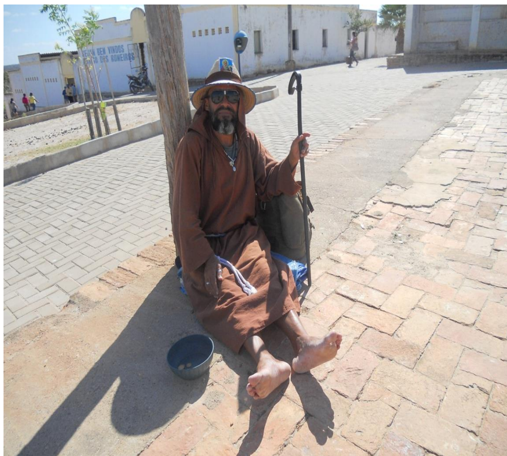
Foto 11: Peregrino Salomão

Apesar do tempo histórico estudado por Davis parecer cronologicamente distante da romaria de Santa Cruz dos Milagres, percebemos que os sujeitos e as práticas ultrapassaram o tempo e a atuação continua praticamente a mesma, ainda há o peregrino epilético, o deficiente acometido por alguma tragédia, as crianças maltrapilhas, mães com bebês seminus apelando pelo coração caridoso de mães e pais devotos de Santa Cruz.