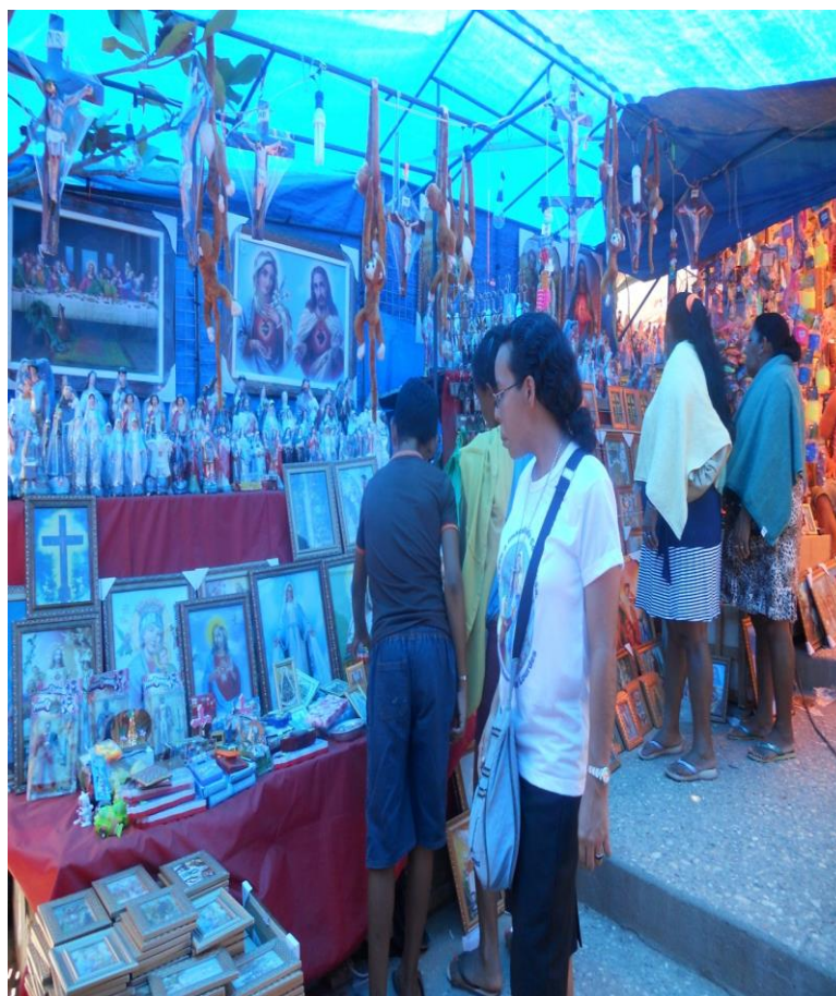
Foto 12: Feira de santos

As barracas de artigos religiosos são mais numerosas e com tamanhos diversificados, vão de barracas pequenas e móveis em forma de grade que acomodam pequenas “reliquias” como terços, chaveiros e fitinhas, às grandes barracas com santos de todos os tamanhos, que vão desde imagens de gesso aos quadros de santos, alguns desconhecidos do domínio popular, mas que caem no gosto pelo poder de convencimento dos vendedores astutos e prontos para novos negócios.