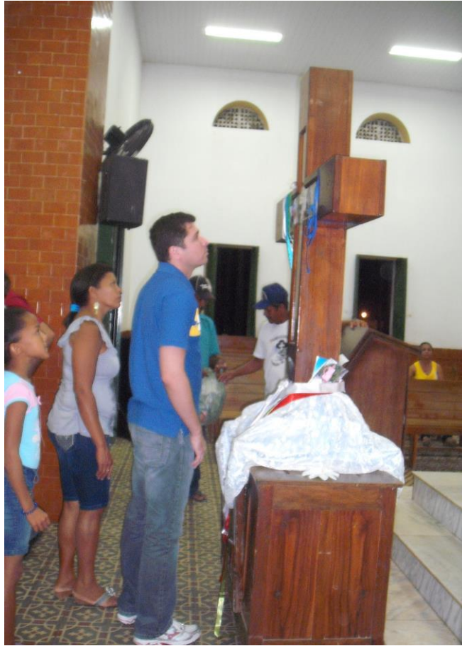
Foto 4: Admiração e devoção