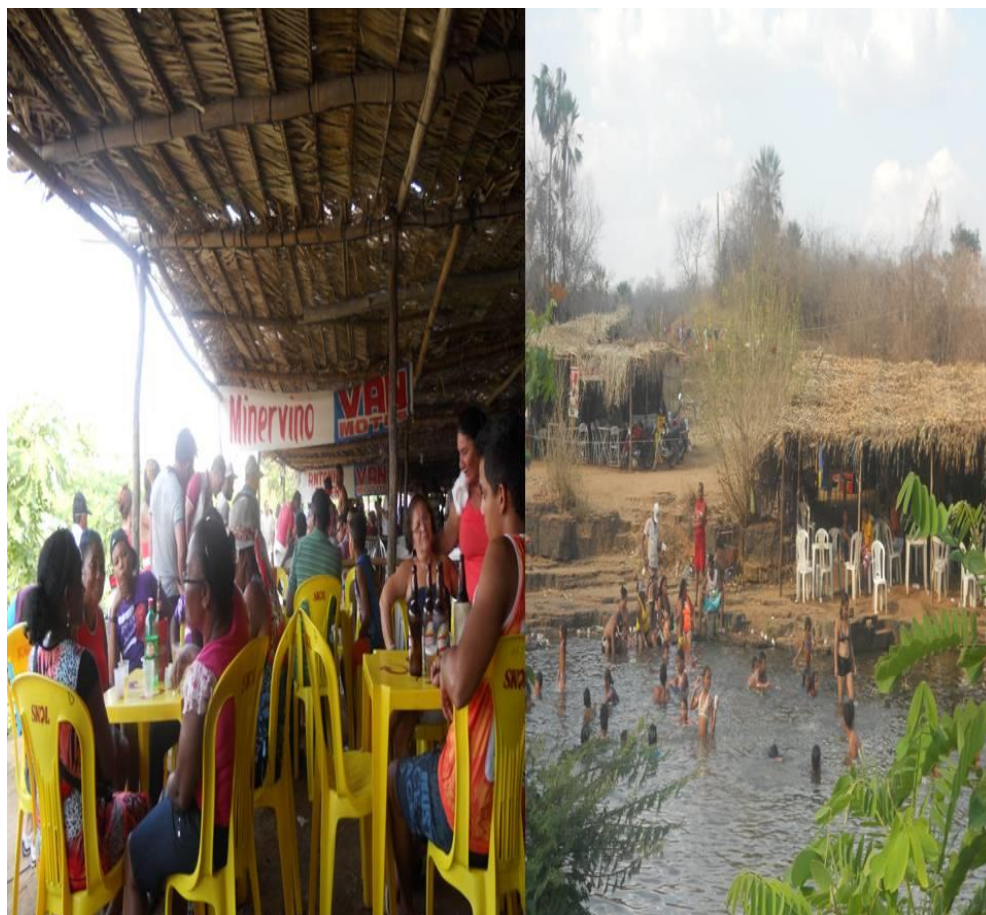
Foto 9: Diversão as margens do São Nicolau

O Rio São Nicolau é um dos lugares mais heterogêneos da festa, espaço onde gostos musicais se confundem em um burburinho muitas vezes incompreensivo. É lugar também onde o mercado atua, com a venda de comidas e bebidas, com barracas que fazem de tudo para atrair o público com música ao vivo e bom atendimento, além disso, por está as margens do rio possibilitam ao cliente se refrescar nas águas do São Nicolau.