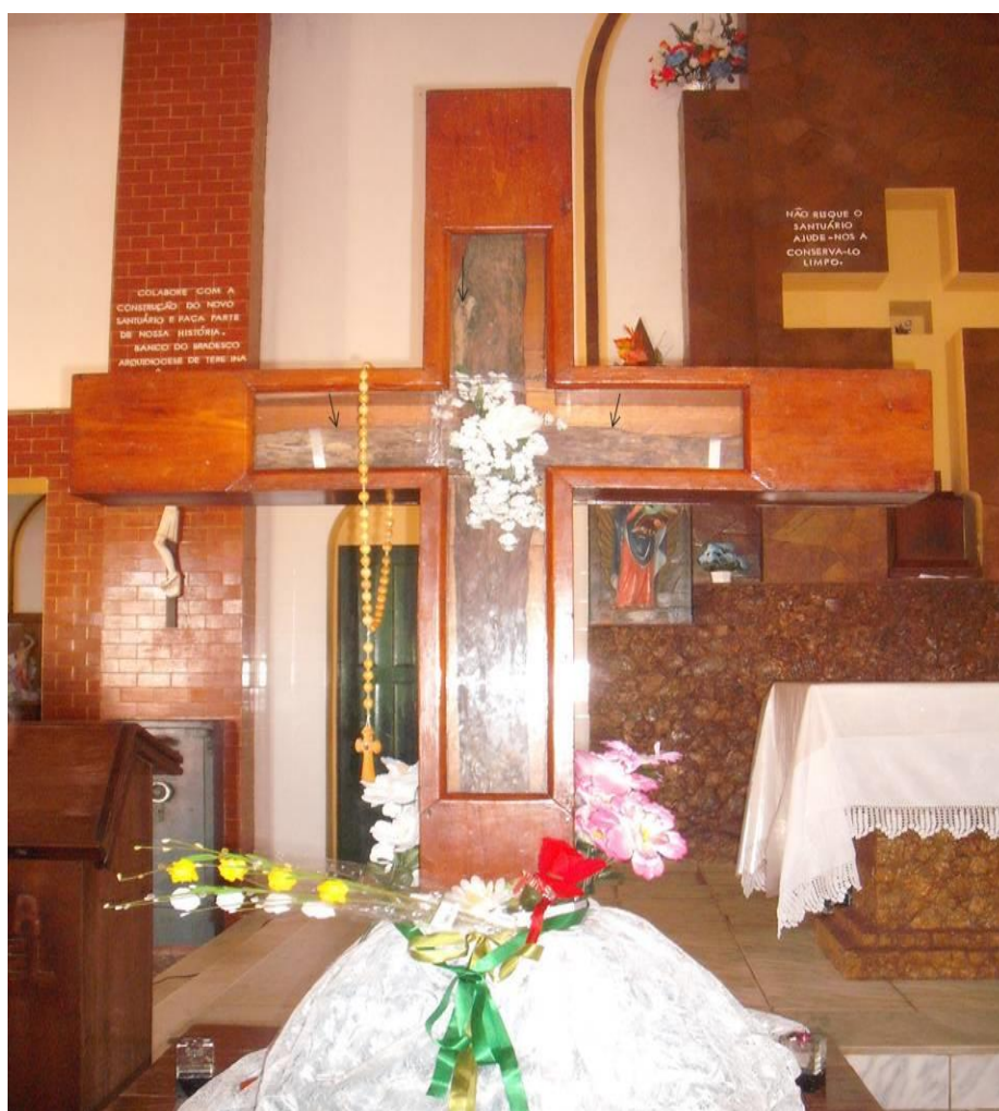
Foto 1: Santa Cruz dos Milagres 78

A Santa Cruz dos Milagres leva em seu “corpo” as cicatrizes da fé, pessoas que acreditam que sua proximidade com a santa pode lhes levar a uma cura rápida, se não se pode levar um patuá da santa, o trajeto é marcado pelas fitinhas com pedidos, deixadas no altar, ou mesmo nas flores e terços, orações que parecem estar estampadas na cruz milagrosa.