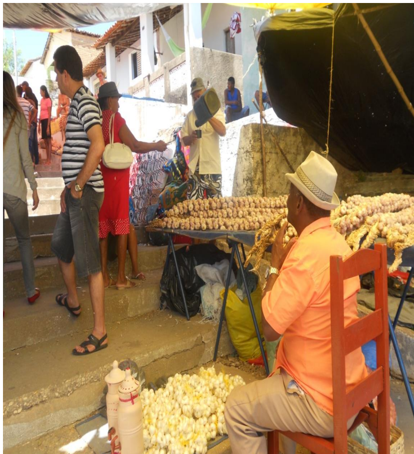
Foto 14: Especiarias de Santa Cruz dos Milagres