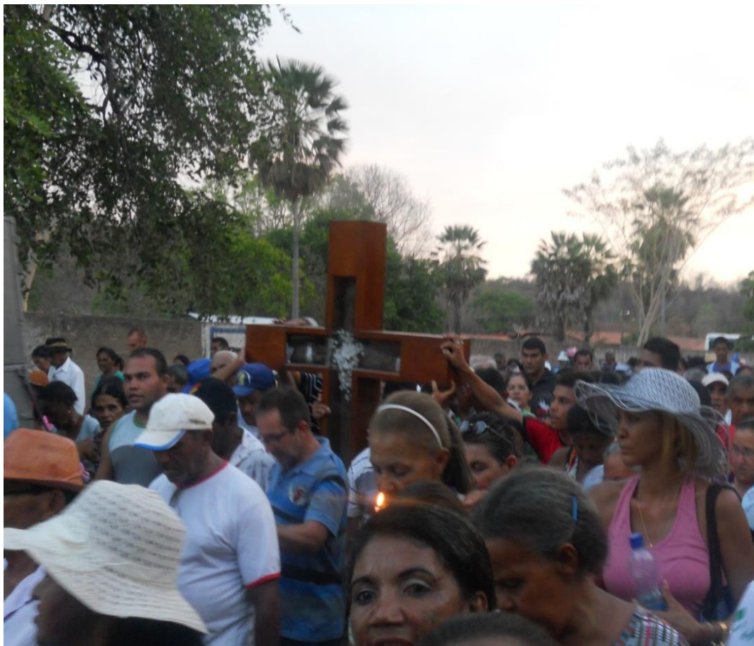
Foto 8: Procissão – Santa Cruz nos braços do povo

Santa Cruz dos Milagres se efetivou ao longo dos anos como um espaço de atração de devotos e admiradores da santa, boa parte formada por camponeses que vêm de várias regiões do Piauí às centenas, geralmente em grupos, ou seja, em romaria, a santa passa a ganhar destaque nos meios de comunicação piauienses a partir da década de 1970, principalmente pela grande explosão de devotos que se deslocavam de suas casas para aproveitar os dez dias de festa.