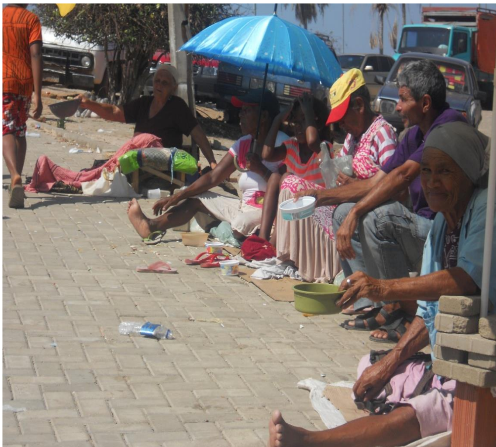
Foto 10: Os “esmoles” de Santa Cruz dos Milagres

O grupo da fotografia acima veio todo do Ceará e a grande maioria é de idosos que tem entre 70 e 80 anos, eles vêm de carro, com um grupo bem grande e heterogêneo, composto também por mulheres jovens, 6 a 7 crianças e uns dois deficientes físicos. O motorista responsável pelo transporte desses pedintes geralmente fica junto aos carros e quase nunca se apresenta, a não ser que o idoso seja deficiente e ele tenha de empurrar a cadeira de rodas, já que região é muito íngreme.